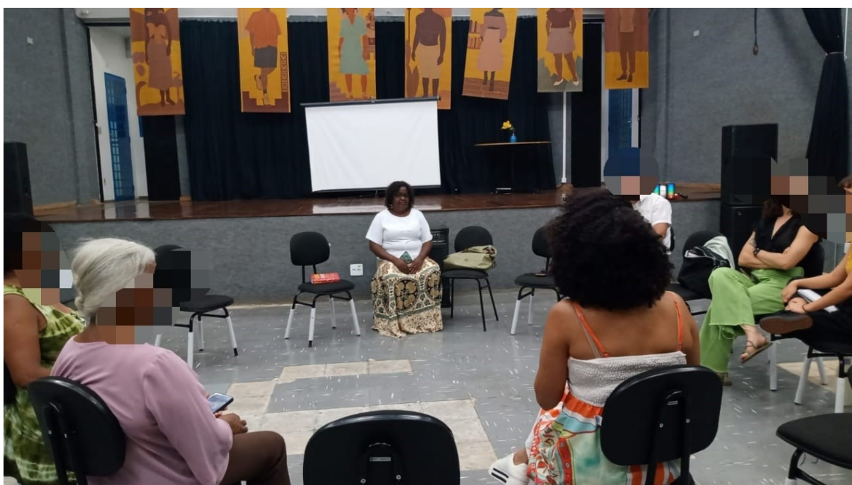
Fotografia 1 – Roda de conversa, Saberes Ancestrais; Corpo Negro e a política