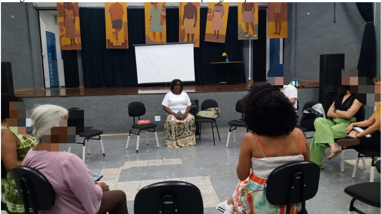
Fotografia 1 – Roda de conversa ‘Saberes ancestrais: corpo negro e a política’