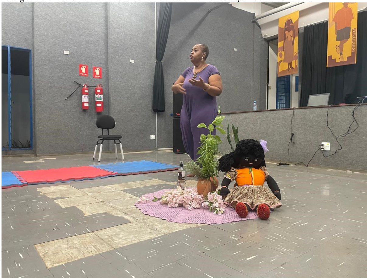
Fotografia 2 – Roda de conversa ‘Saberes ancestrais e a relação com a natureza’