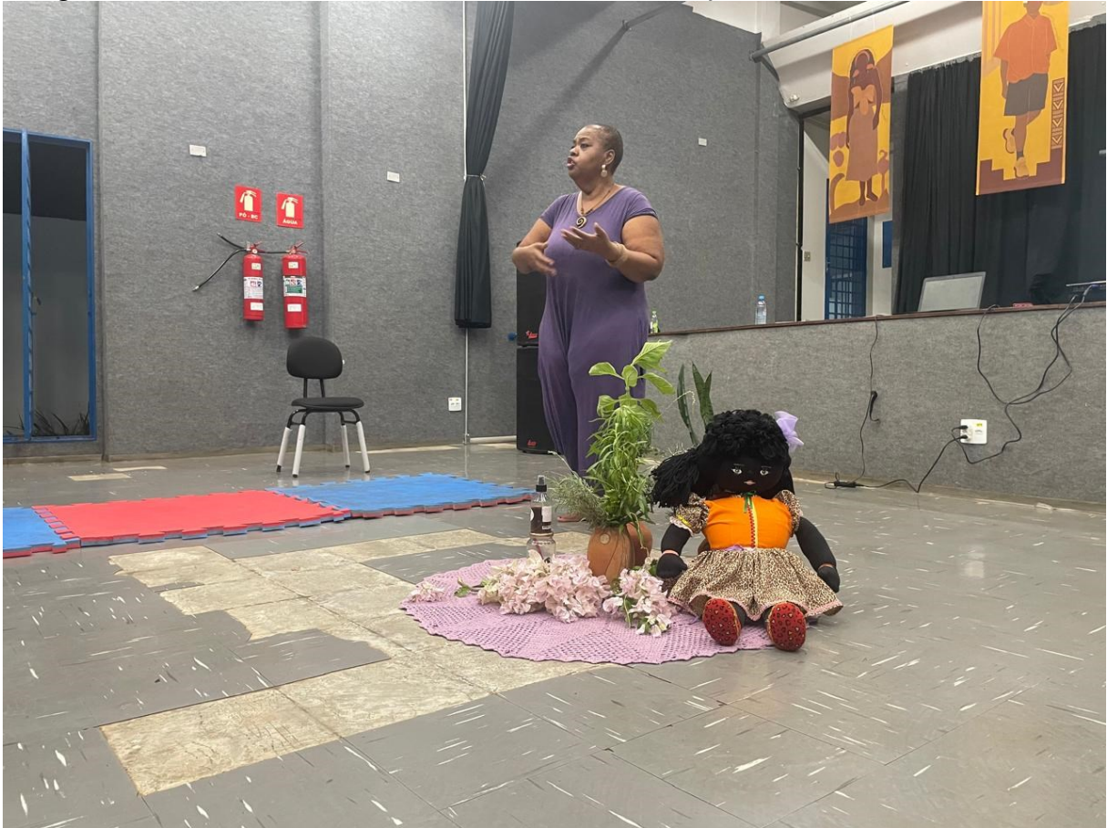
Fotografia 2 – Roda de conversa ‘Saberes ancestrais e a relação com a natureza’