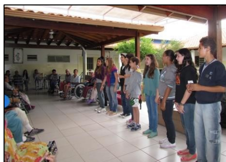
Figura 21 - Visita ao Lar André Luiz

Entre os meses de setembro e outubro de 2012 o projeto PAS realizou uma campanha de arrecadação de brinquedos na escola, que culminou com o que está retratado nas Figuras 22 e 23, adiante. As fotos mostram momentos vivenciados pela