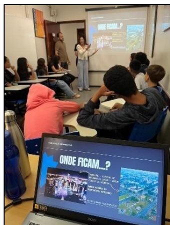
Figura 14 - Oficina Consciência Negra 6º ano

Uma ação do Pibid que teve um grande impacto, a meu ver, foi a oficina “Consciência negra: herança linguístico-cultural”, ofertada aos 6º e 7º anos da escola. O objetivo era apresentar aos participantes a riqueza da cultura negra e como seu legado se expressa nas diversas línguas. Após pesquisa para embasamento e planejamento das atividades, realizou-se oficinas em seis turmas dos 6º e 7º anos, abordando a influência das línguas de origem africana no espanhol, francês, inglês e português, procurando quebrar expectativas preconceituosas dos estudantes com relação à riqueza linguístico-cultural africana. Em suas reflexões acerca da oficina, os IDs destacaram a importância de se abordar os aspectos político-culturais das línguas abordadas com vistas a ampliar a visão de mundo dos estudantes.