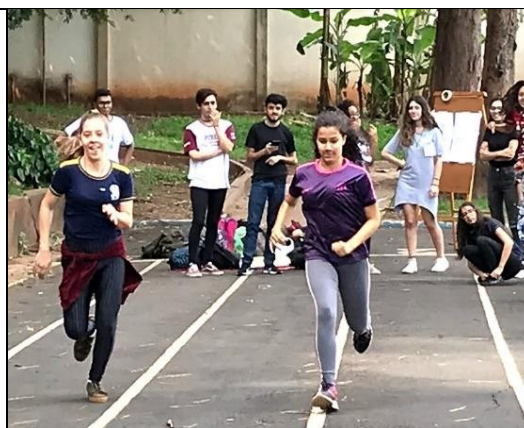
Figura 6 – Gincana durante minicurso Pibid