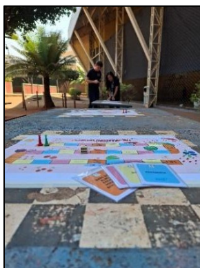
Figura 10 - PluriAlimentação