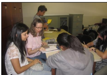
Figura 20 - Preparação visita Lar André Luiz

Foi uma experiência que desencadeou sentimentos diversos, pois, sem dúvida, despertou a compaixão de muitos em função da tristeza que alguns idosos demonstravam, mas trouxe também gratidão pela oportunidade de oferecer afeto, presença. Além disso, provocou muita alegria, pois muitos dos idosos que residiam na instituição demonstravam encarar a vida com muita resiliência, humildade e alegria contagiante.