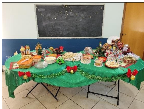
Figura 18 – Festa encerramento PLA - nov. 2022