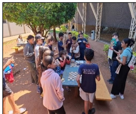
Figura 11 - Jogo de Força plurilíngue