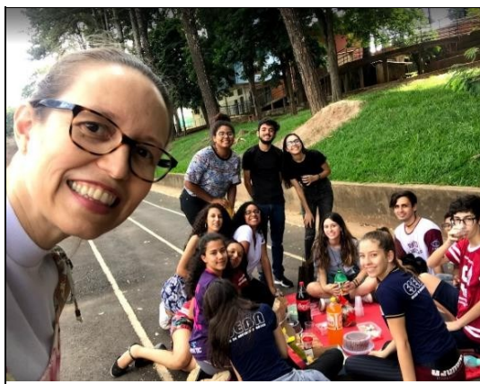
Figura 5 – Encerramento minicurso Pibid