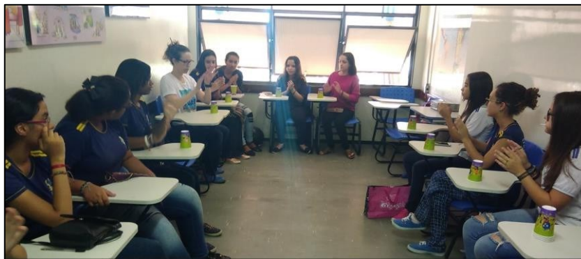
Figura 32 - Oficina “Aprendendo inglês por meio da música”

Em junho de 2018 escrevi e apresentei o trabalho intitulado “Contribuições para a inclusão social na Educação de Jovens e Adultos por meio da Língua Inglesa e das Tecnologias Digitais da Informação e Comunicação” na X Semana Nacional de Letras, trabalho que considero “lindo” porque faz uma interlocução entre ensino de língua inglesa, letramento digital e um sentimento muitas vezes considerado tabu no campo da educação: o amor (Barcelos; Coelho, 2016).