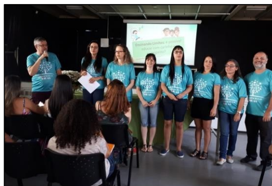
Figura 29 - Evento Projeto Integrar - set. 2018