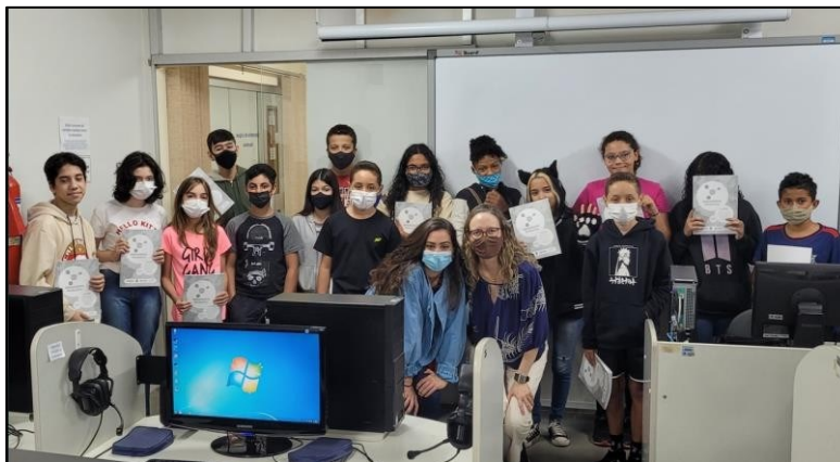
Figura 31 - Adolescentes Políglotas 2022 em formato híbrido