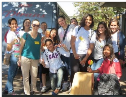
Figura 24 - Saída para Casa CAROL