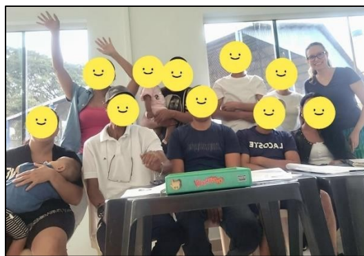
Figura 19 - Sete nacionalidades em aula de PLA

Após o resgate das principais experiências vivenciadas por mim no campo do ensino, passo em seguida a focalizar minha carreira docente sob a perspectiva da extensão.