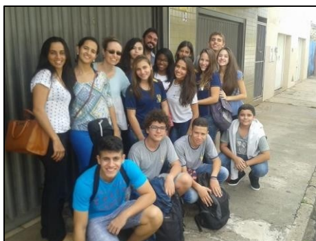
Figura 26 - Projeto PAS em visita à FALE

Foi um momento de muita aprendizagem, em função principalmente da recepção maravilhosa que tivemos por parte dos assistidos da instituição, que compartilharam suas emocionantes histórias, ofertando preciosíssimas lições de vida a todos nós, particularmente aos nossos adolescentes que puderam vivenciar uma experiência ímpar em suas vidas.