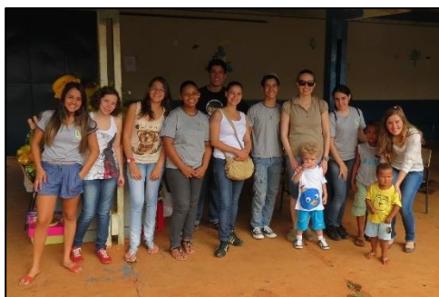
Figura 22 - Projeto PAS na Casa do Caminho

equipe do projeto junto às crianças da instituição Casa do Caminho. Nossos estudantes conheceram de perto a realidade das crianças e compartilharam com elas momentos de muita alegria, tanto na distribuição dos brinquedos provenientes das doações recebidas como nas atividades lúdicas desenvolvidas.