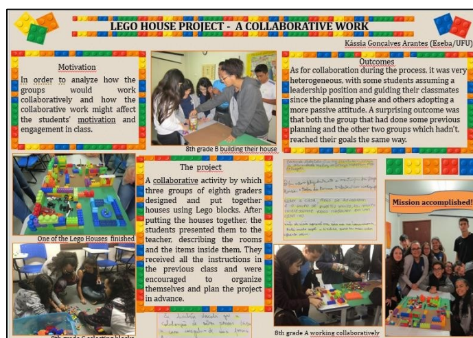
Figura 34 - Pôster Congresso Braz-Tesol Triângulo Mineiro