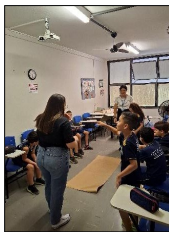
Figura 8 - Oficina “Como eu sou?”

Uma outra ação realizada no âmbito do Pibid é um projeto denominado “PluriAção”. Lembrando que essa edição se trata de um subprojeto interdisciplinar que envolve as três licenciaturas (Letras/Espanhol, Letras/Francês e Letras/Inglês), o prefixo Pluri- utilizado procura fazer uma alusão a essa pluralidade linguística, a qual pretendemos sempre destacar. Tal projeto tem como objetivo sensibilizar os estudantes do ensino fundamental quanto às línguas estrangeiras fora do ambiente da sala de aula, de forma lúdica e descontraída, além de dar visibilidade ao Pibid no ambiente escolar. São realizadas dinâmicas, minigincanas e jogos durante o horário do recreio das turmas do 7º, 8º e 9º anos da Eseba/UFU. O projeto tem alcançado um ótimo engajamento dos discentes da educação básica ao proporcionar experiências divertidas e educativas durante os intervalos das aulas, ou seja, em espaços e tempos não convencionais de aprendizagem.