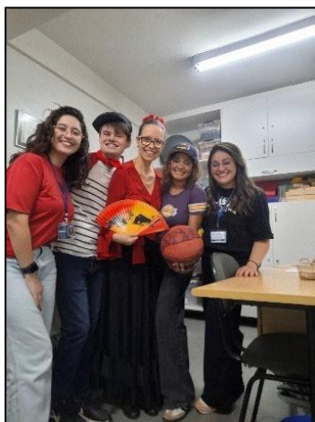
Figura 7 – Oficina “Quem sou eu?”

em espanhol, francês e inglês através de dinâmicas e atividades lúdicas, assim como propor reflexões a respeito de cuidados com o corpo e saúde.