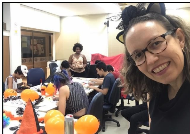
Figura 30 - Halloween 2019 Adolescentes Políglotas