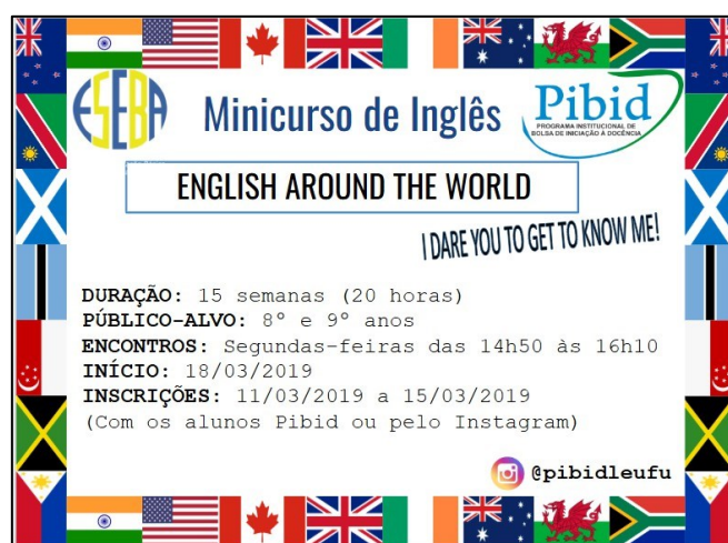
Figura 3 - Cartaz minicurso “ English Around de World ”

A primeira ação do grupo de 2018/2019 que envolveu os discentes do ensino fundamental foi o minicurso “ English around the world ”, que foi construído colaborativamente, desde seu planejamento, passando pela produção de material didático, e culminando em sua execução frente ao discente da escola. Tal minicurso contemplou a articulação entre a cultura de países anglófonos e aspectos linguísticos do inglês, trabalhado em suas quatro habilidades (leitura, escrita, compreensão auditiva e fala), procurando estabelecer relações entre língua, cultura e questões sociais.