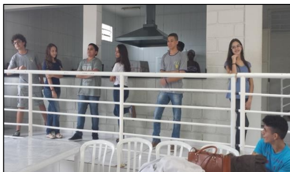
Figura 27 - Atividade Projeto PAS na Fale

A situação dos soropositivos tem mudado muito nos últimos anos, em função do avanço de pesquisas que têm desenvolvido tratamentos cada vez mais eficazes. Felizmente, isso repercute em melhor qualidade de vida, além de mais acolhimento por parte da sociedade. Contudo, ainda que reduzido, o preconceito ainda existe, fruto da falta de conhecimento. E ações como essa desenvolvida dentro do projeto PAS exercem um papel importantíssimo para o esclarecimento da sociedade e quebra de