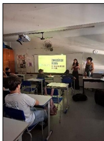
Figura 15 - Oficina Consciência Negra 7º ano

Procurei resgatar algumas das principais atividades desenvolvidas dentro do Pibid, um projeto que me proporciona sentimentos ambíguos. Ao mesmo tempo que eu o considero uma das mais completas e gratificantes experiências em minha carreira docente, eu também o percebo como extremamente desafiador, particularmente no subprojeto interdisciplinar. Na minha perspectiva, o desafio está no gerenciamento das relações que se estabelecem no âmbito do subprojeto, uma vez que é preciso conciliar meus anseios e temores com os anseios e temores de jovens adultos provenientes de três licenciaturas diferentes, tendo em vista ainda que nosso público-alvo são crianças e adolescentes da educação básica.