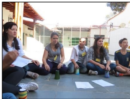
Figura 25 - Atividade na Casa CAROL

Em 2014, o projeto PAS organizou uma visita à Fraternidade Assistencial Lucas Evangelista (FALE), uma entidade sem fins lucrativos que tem como objetivo acolher pessoas portadoras do vírus HIV. Conforme prática do projeto, houve um período de preparação de caráter informativo, além do planejamento e organização de um lanche que compartilharíamos no dia da visita à FALE.