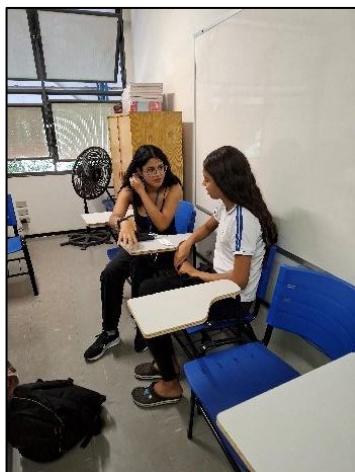
Figura 12 – Oficina EquiparAção

Fizemos a opção pela suspensão por considerar que uma oficina de equiparação demanda um grupo minimamente estável, pois requer um diagnóstico inicial e acompanhamento constante. Assim sendo, decidimos destinar as IDs que estavam à frente dessa oficina para outras ações que contavam com mais participantes e, conseqüentemente, demonstravam ter maior impacto nas turmas do ensino fundamental.