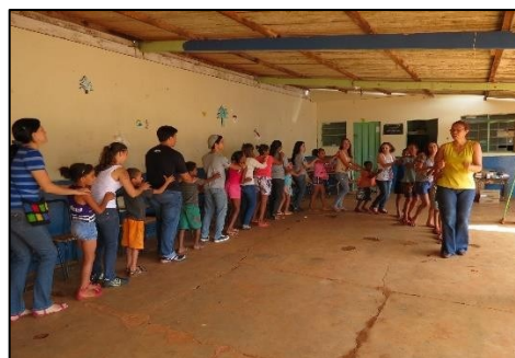
Figura 23 - Recreação Casa do Caminho

No segundo semestre de 2013, as ações propostas pelo projeto PAS culminaram com uma visita à Casa de Amparo Infantil CAROL, instituição destinada ao amparo temporário de crianças em situação de violência doméstica e familiar. Para essa atividade, foi realizada uma campanha de doação de roupas e fizemos um preparo muito cuidadoso, durante o qual os nossos estudantes foram conscientizados sobre a situação de extrema vulnerabilidade das crianças e adolescentes que encontraríamos e sobre formas de se comportar durante a visita. Por questões de segurança, os trabalhadores da Casa Carol nos pediram que as fotos das crianças residentes na casa não fossem divulgadas. Por essa razão, as Figuras 24 e 25, a seguir, retratam apenas os membros do projeto PAS.