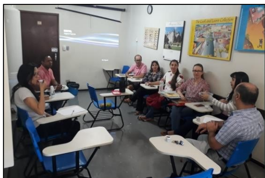
Figura 28 - Reunião membros projeto Integrar

A cada ano, o grupo define um tema condutor das discussões e ações do projeto e realiza reuniões e pequenas ações ao longo de todo o ano, que culminam em um evento anual realizado em um sábado letivo do segundo semestre do ano, no qual são realizadas ações com variadas propostas destinadas à comunidade escolar. Em 2018, por exemplo, o tema que orientou as propostas desenvolvidas foi “Valorização das Vidas”, conforme ilustram as figuras compartilhadas a seguir.