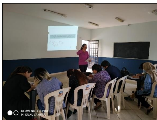
Figura 17 – Aula de PLA em 2022