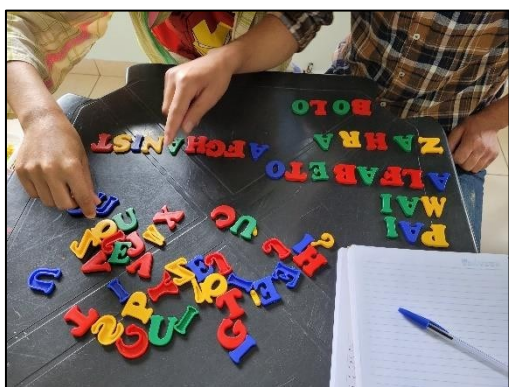
Figura 16 - Atividade pedagógica de PLA em 2022

Por questões de segurança, nos solicitaram que não publicássemos as fotos tiradas durante as aulas ou outros eventos do grupo. Mas para encerrar o registro desse momento de minha carreira docente, apresento, a seguir, algumas fotos sem exposição de rostos (Figuras 16, 17, 18 e 19), para compartilhar a abençoada oportunidade que tive de aprender com seres humanos incríveis que, naquele momento, chegavam a um país novo, sem compreender a língua, sem trabalho, longe de suas famílias, longe de suas casas e de tudo que construíram. Espero ter conseguido, ainda que minimamente, ajudá-los a reconstruir seus caminhos com esperança em dias melhores.