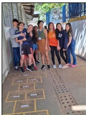
Figura 9 - Amarelinha plurilíngue

Uma outra ação realizada no âmbito do Pibid é um projeto denominado “PluriAção”. Lembrando que essa edição se trata de um subprojeto interdisciplinar que envolve as três licenciaturas (Letras/Espanhol, Letras/Francês e Letras/Inglês), o prefixo Pluri- utilizado procura fazer uma alusão a essa pluralidade linguística, a qual pretendemos sempre destacar. Tal projeto tem como objetivo sensibilizar os estudantes do ensino fundamental quanto às línguas estrangeiras fora do ambiente da sala de aula, de forma lúdica e descontraída, além de dar visibilidade ao Pibid no ambiente escolar. São realizadas dinâmicas, minigincanas e jogos durante o horário do recreio das turmas do 7º, 8º e 9º anos da Eseba/UFU. O projeto tem alcançado um ótimo engajamento dos discentes da educação básica ao proporcionar experiências divertidas e educativas durante os intervalos das aulas, ou seja, em espaços e tempos não convencionais de aprendizagem.