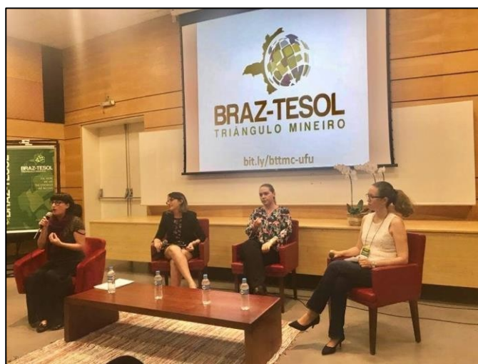
Figura 33 - Mesa redonda “Women in ELT”

no qual é exposta minha motivação para adotar o projeto, além de uma breve descrição e os principais resultados observados ao realizar a atividade com os estudantes.