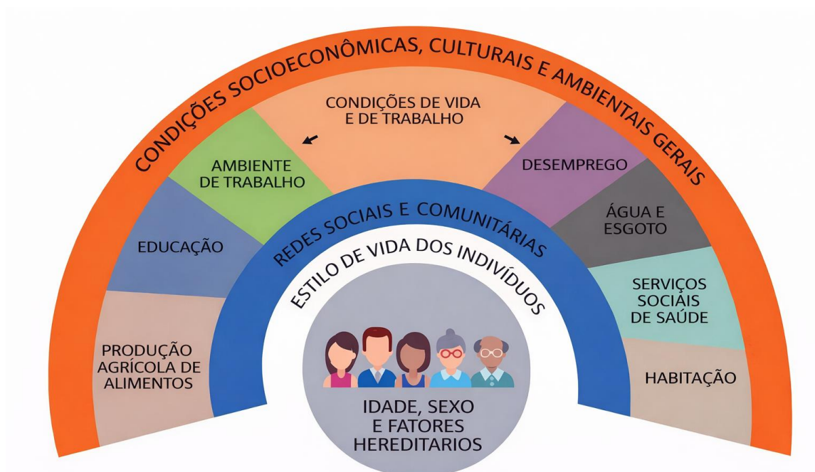
Figura 3. Representação esquemática dos determinantes sociais da saúde, segundo o modelo de Dahlgren e Whitehead (1991)

Fonte: Adaptado de Dahlgren e Whitehead (1991, p. 11)