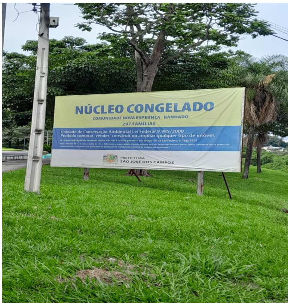
Banner da Prefeitura de São José dos Campos em frente à comunidade Nova Esperança(03/02/2025).

O banner acima, posto em frente a comunidade Nova Esperança, expõe uma mensagem: “Núcleo Congelado”, também chamado de núcleo urbano informal congelado. Tal expressão define uma área de ocupação urbana irregular que, por decisão do poder público, tem sua expansão proibida. Essa medida visa controlar o crescimento demográfico do local e evitar a formação de novos assentamentos informais. A prática de congelamento é prevista na Lei Federal nº 13.465/2017 , que trata da regularização fundiária no Brasil. Segundo tal lei, os