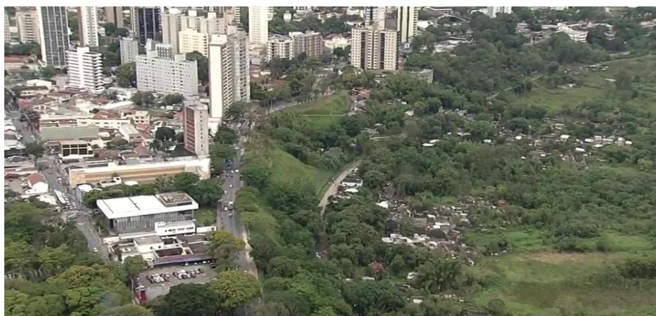
Foto aérea da comunidade do banhado.