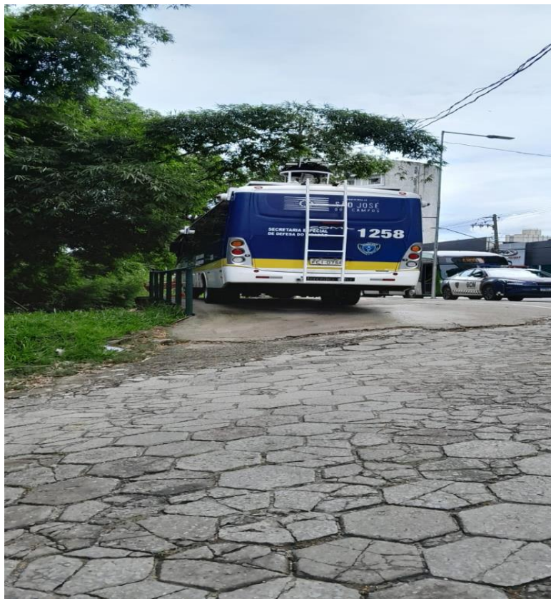
Unidade móvel e viatura da Guarda Civil Municipal em frente à entrada do Jardim Nova Esperança (03/02/2025).