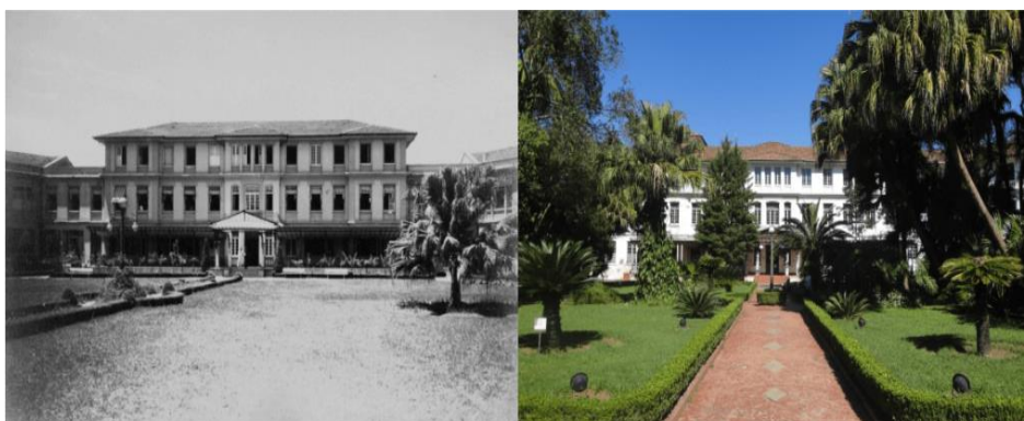
Sanatório Vicentina Aranha antes (esquerda) e atualmente revitalizado (direita).