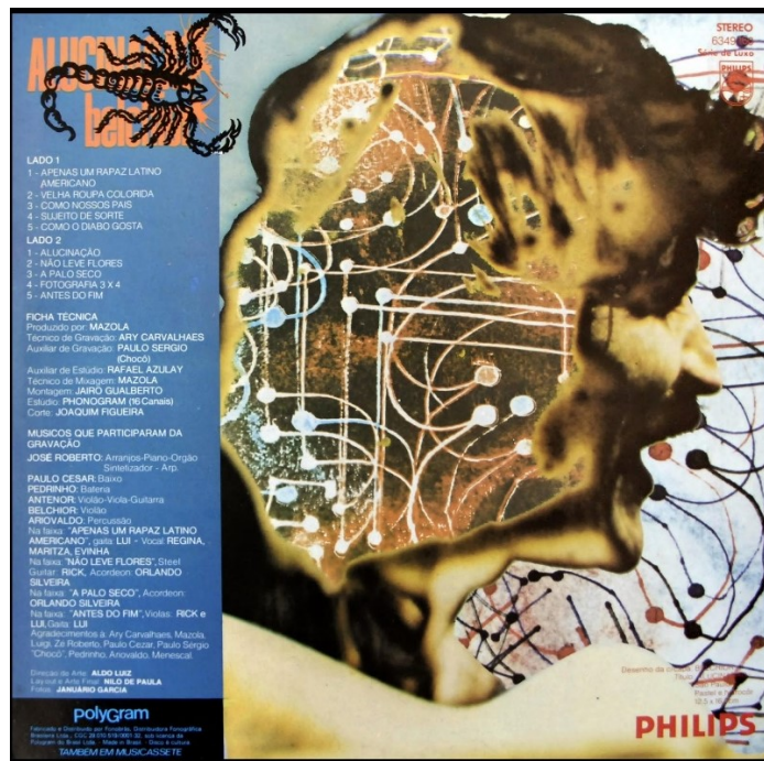
Figura 2: Contracapa do álbum Alucinação. Fonte: Google 8

Na contracapa, encontramos um desenho criado pelo próprio Belchior, que leva o mesmo título do álbum, "Alucinação". (CAVIOLA, 2024).