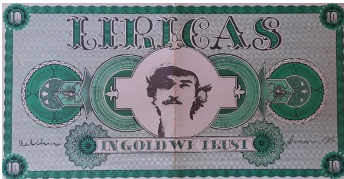
Figura 3: Encarte do álbum Alucinação. Fonte: Google 9

O encarte de Alucinação apresenta uma montagem gráfica com referências a uma cédula de dólar, com a imagem do artista centralizada. Ao topo, a palavra “Lírica”, abaixo, a seguinte frase: “in gold we trust”, nós acreditamos no ouro, um trocadilho com a expressão “in god we trust”, nós acreditamos em Deus.