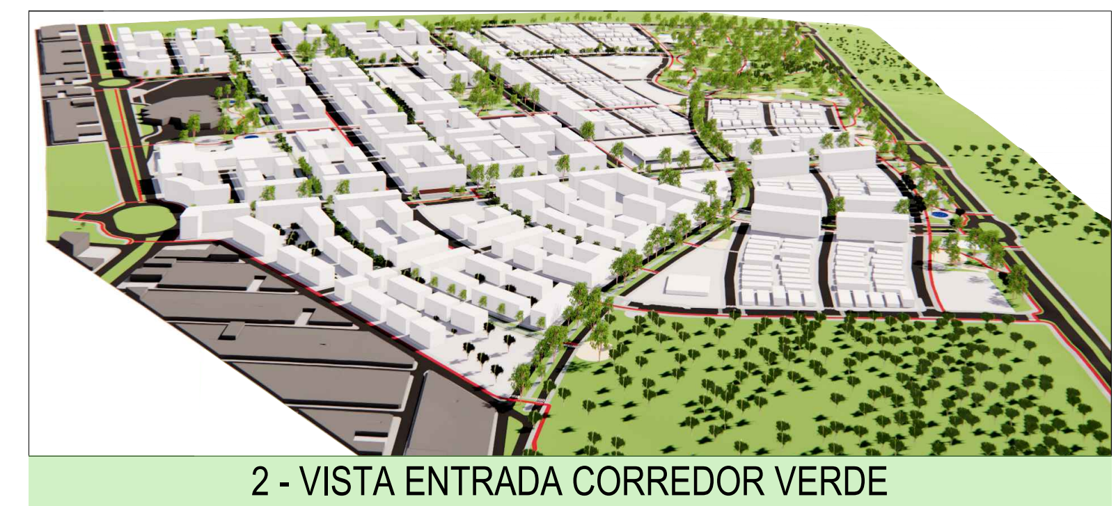
2 - VISTA ENTRADA CORREDOR VERDE