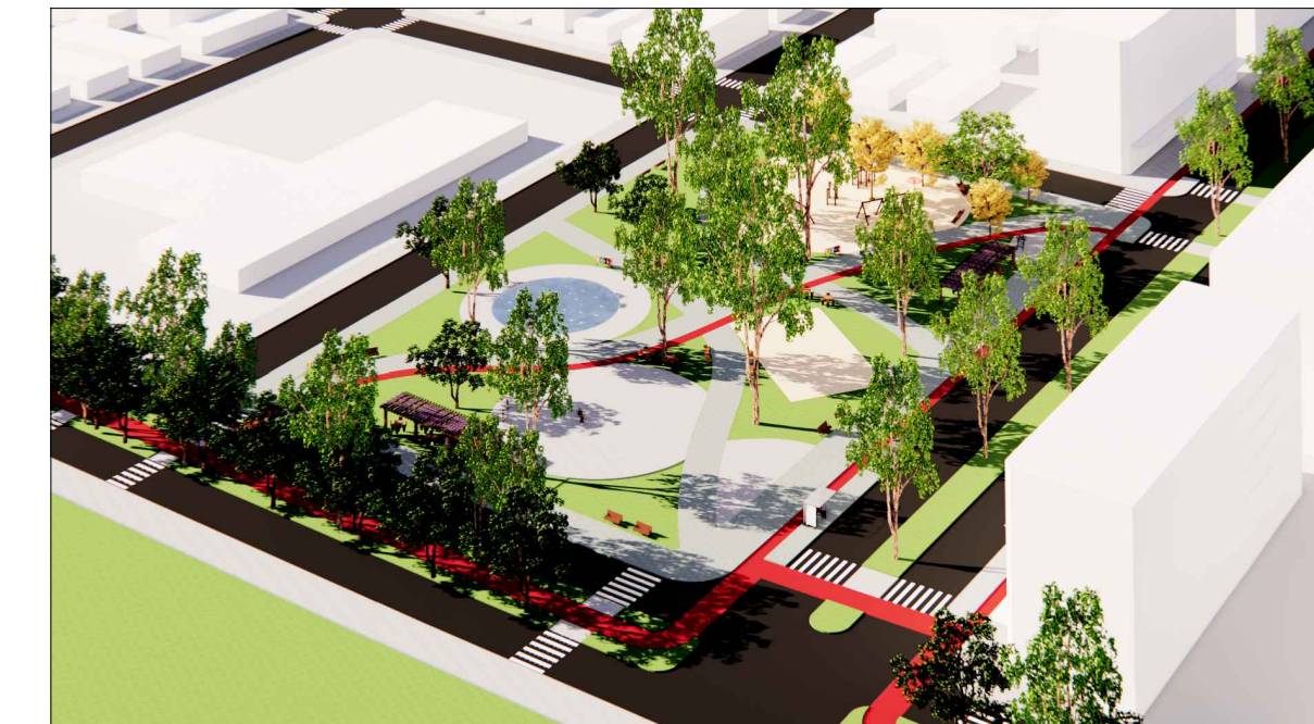
4 - VISTA DA PRAÇA