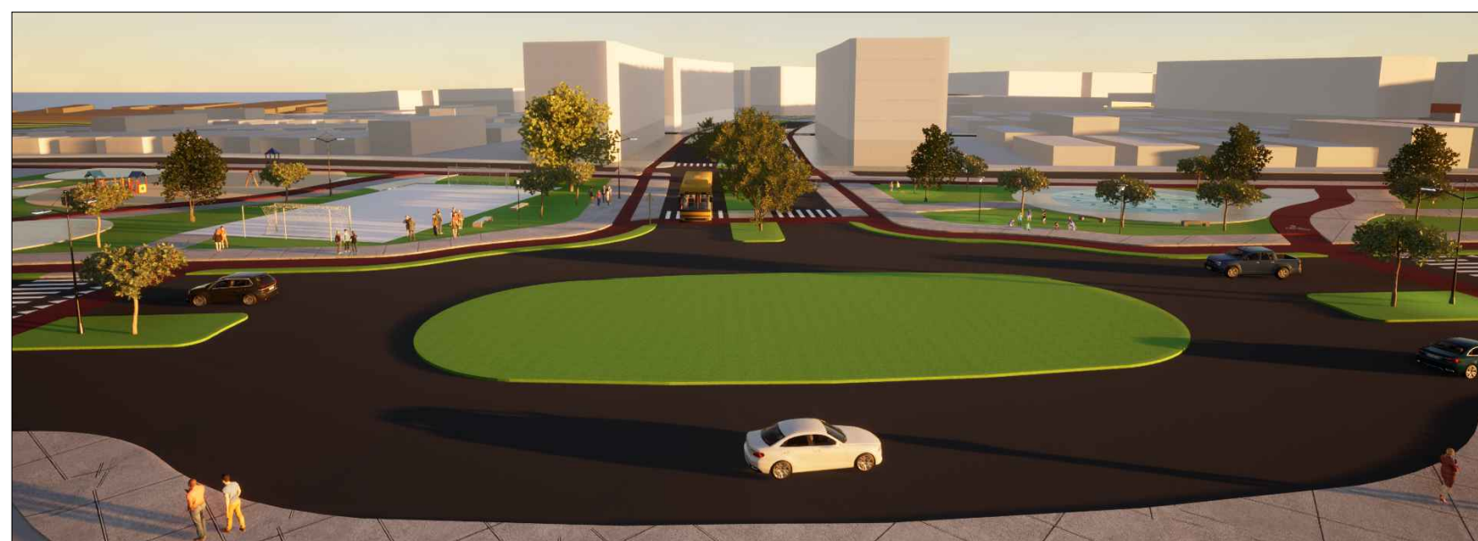
6 - VISTA ENTRADA VIA MULTIMODAL PELA BR-497