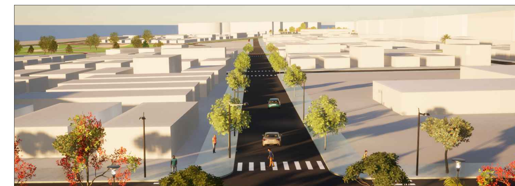
14 - VISTA VIA LOCAL