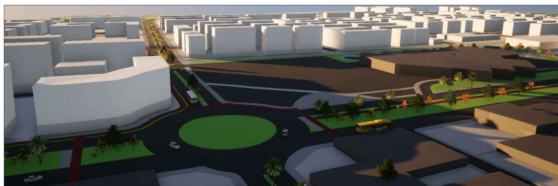
12 - VISTA DA ROTATÓRIA DE ACESSO AO TERMINAL