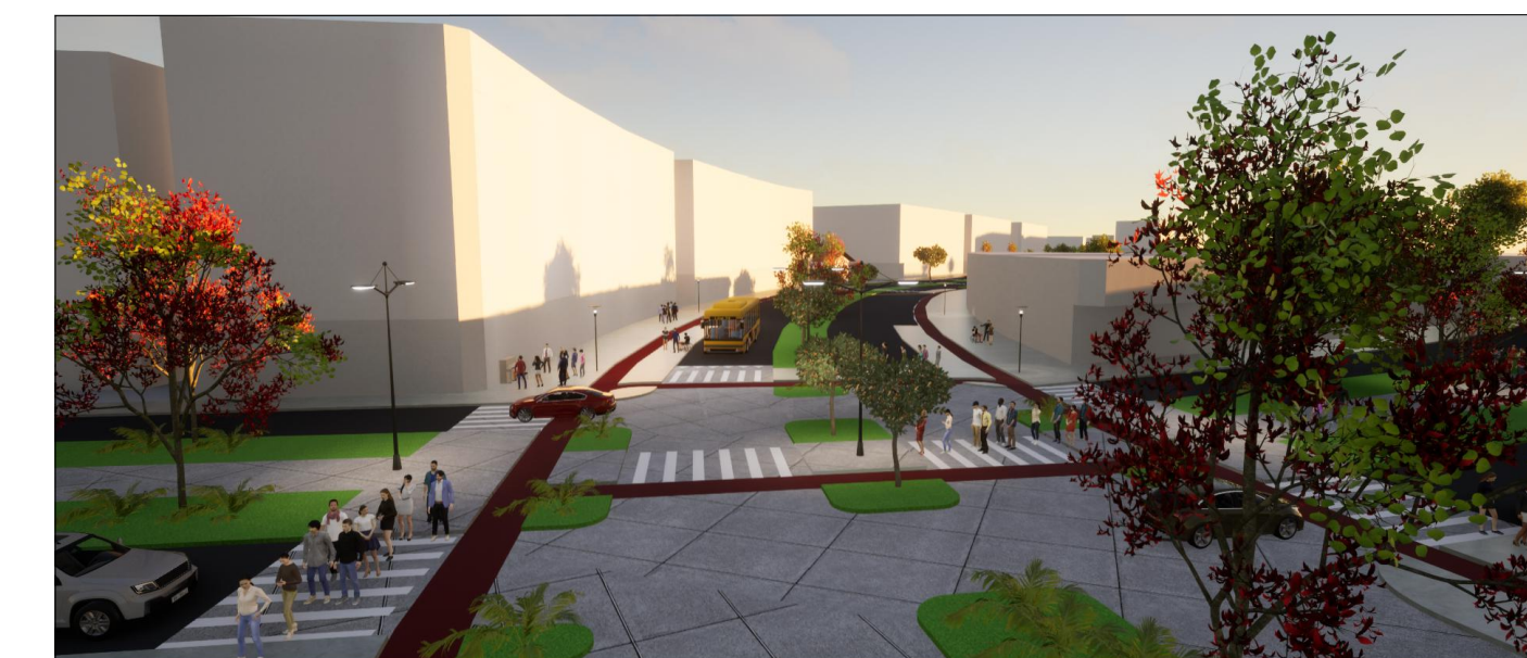
7-VISTA CRUZAMENTO VIA MULTIMODAL-CORREDOR VERDE