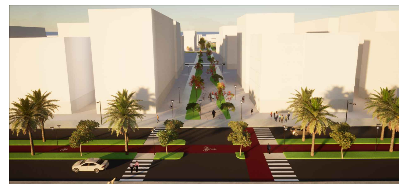
13 - VISTA VIA LOCAL SINUOSA PELA VIA COLETORA