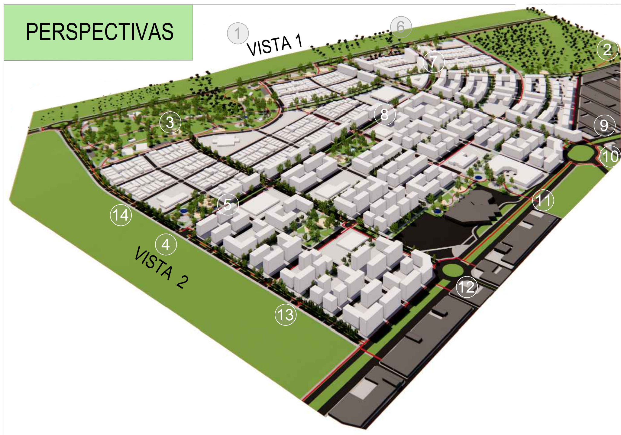
VISTA PANORÂMICA BAIRRO GRANJA PLANALTO