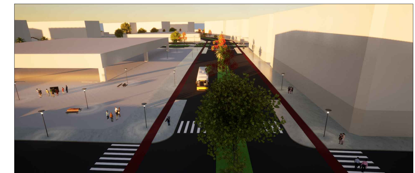
8 - VISTA EQUIPAMENTO CULTURAL PELA VIA MULTIMODAL