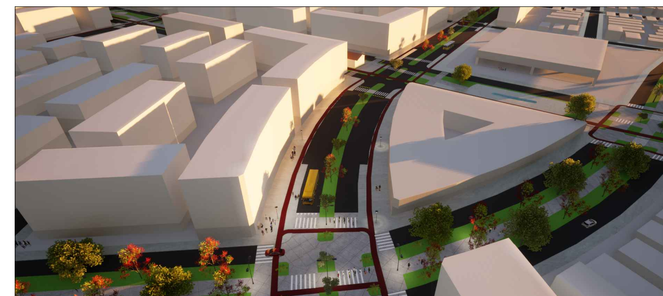
7 - VISTA CRUZAMENTO PRINCIPAL- CENTRO COMERCIAL