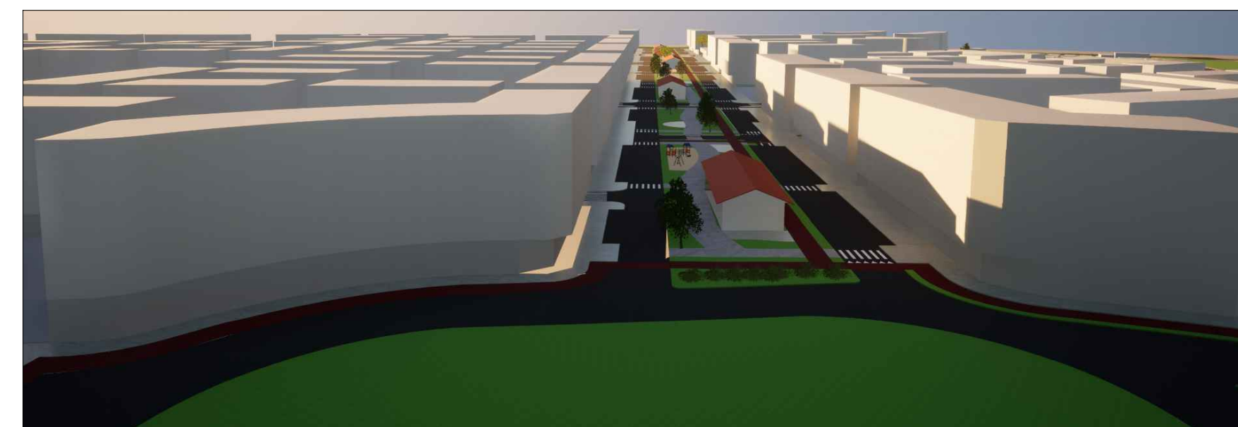
10 - VISTA BOULEVARD PELA ROTATÓRIA PRINCIPAL DO ENTORNO