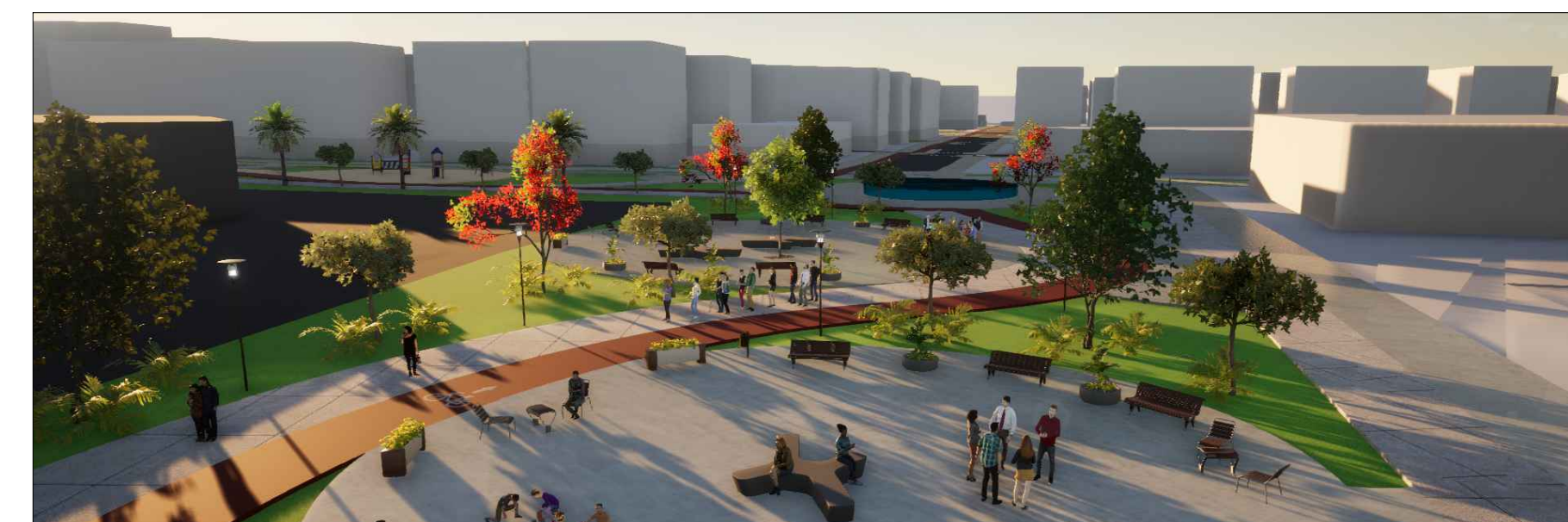
11 - VISTA DA PRAÇA DO TERMINAL