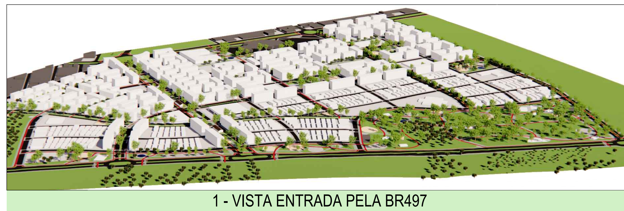
1 - VISTA ENTRADA PELA BR497