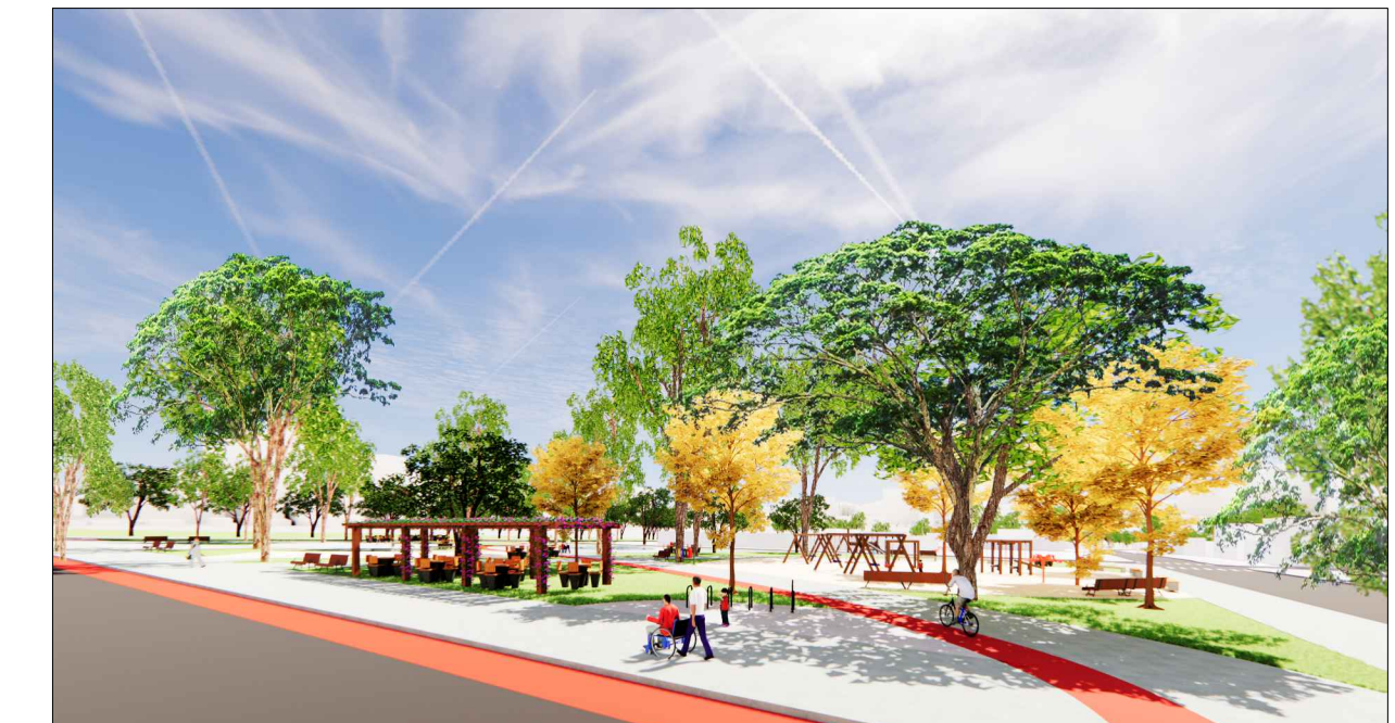
5 - VISTA DA PRAÇA DA VIA MULTIMODAL