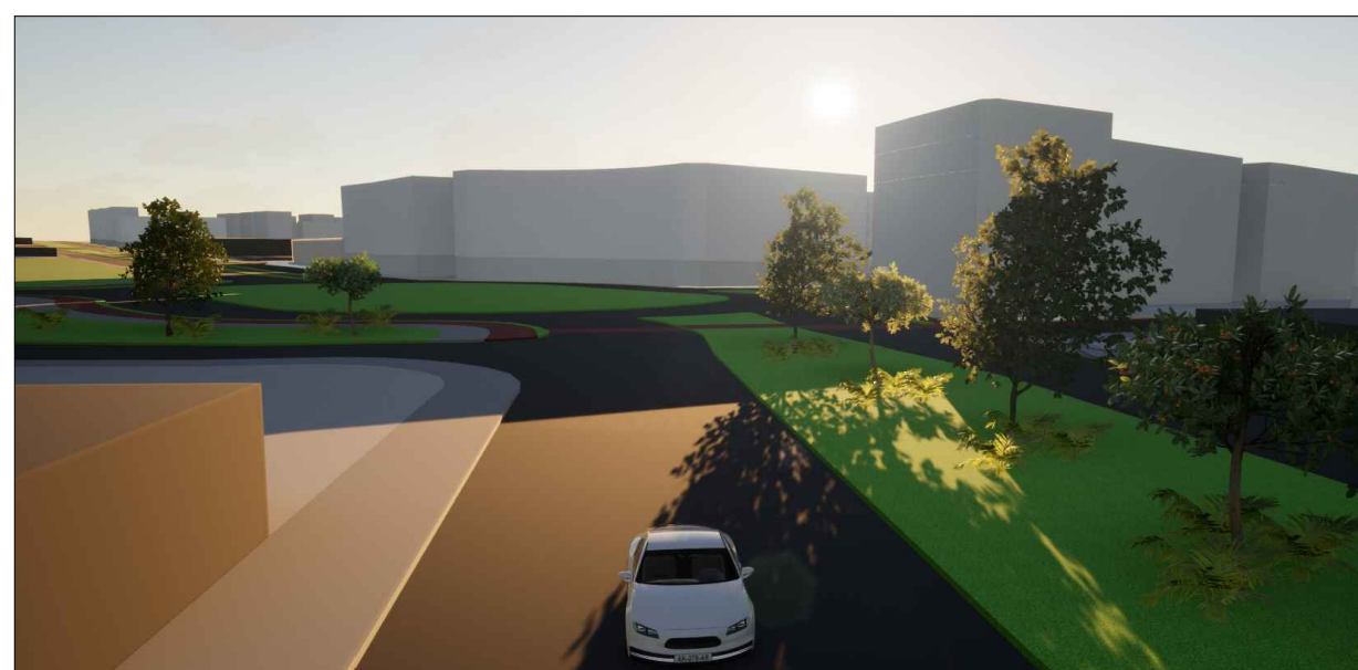
9 - VISTA ROTATÓRIA PRINCIPAL PELA AV. JUDEIA