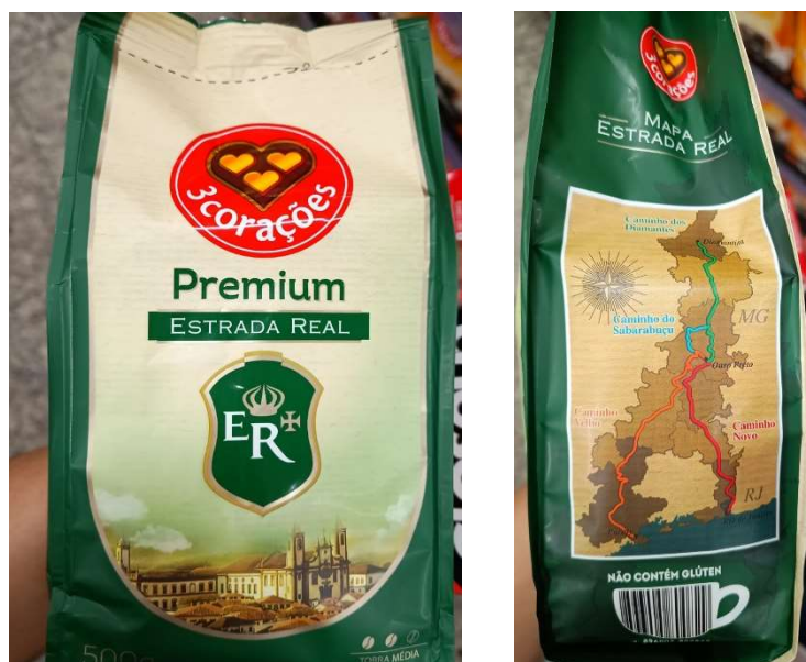
(figura 7, 8 e 9) Café Premium Estrada Real. Tirada no dia 06/11/24.

Assim como, o café Três corações, fundado em 1970, na região metropolitana de Santa Luiza., que leva em uma de suas embalagens, de um tipo específico de café, o slogan da Estrada Real, bem como, uma imagem ilustrativa dos caminhos incluídos no percurso do programa Estrada Real, expressando de forma informativa sobre o programa, e seus circuitos. Sendo este também um produto que ganhando o seu espaço em todo o estado, e em outras localidades, ao também se associar ao programa. Contendo sua imagem inserida logo abaixo, neste trabalho, - de autoria própria, e tirada no supermercado BH, no município de Nova Lima -MG.