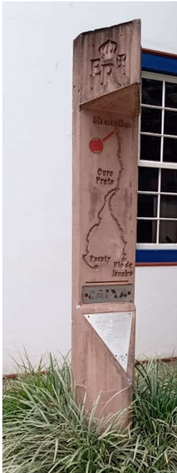
(Fig.5) Marco Zero do Programa Estrada Real, em Diamantina-Mg. Foto tirada em 18/11/24.