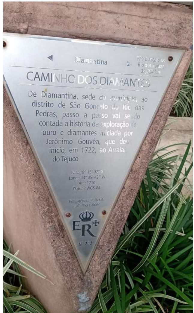
Fig(Fig. 6) Foto tirada em 18/11/24, em Diamantina-Mg.

Em sequência a cerimônia oficial de lançamento do programa, por meio do PPAG 9 2004-2007 (Plano Plurianual de Ação Governamental) para o período informado, tem início uma série de ações que visavam não somente a promoção e a divulgação do programa Estrada Real, mais, também, o desenvolvimento do turismo; conforme Relatório de Execução do Projeto Estruturador da Estrada Real. Onde o foco principal dessas ações, são os municípios e circuitos turísticos, que fazem parte da área de influência da Estrada Real. Já as ações referenciadas nesse relatório, são: