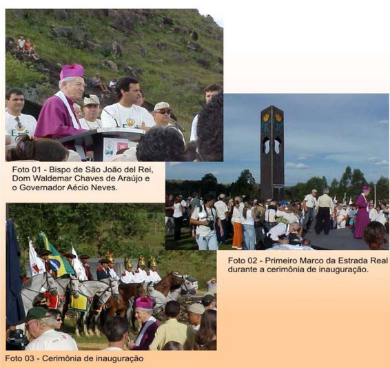
(Figura 04 - Inauguração do Primeiro marco da Estrada Real, parte integrante da Cerimônia oficial de lançamento do Programa.)