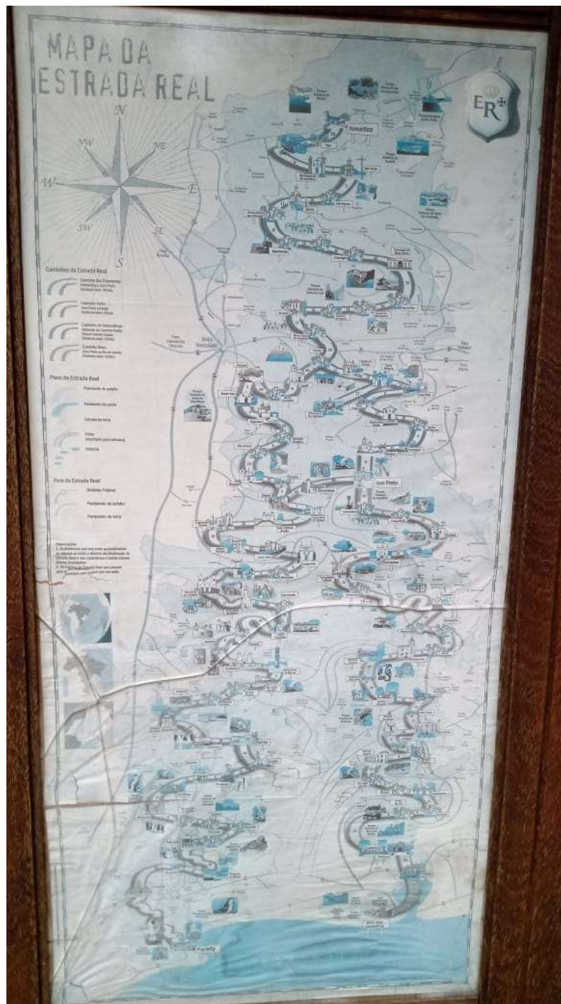
(Fig.2) Mapa da Estrada Real, feito pelo Programa Estrada Real, em Diamantina. Foto tirada em 18/11/24.

conjunto Moderno da Pampulha em Belo Horizonte. Os quais foram tombadas pela Unesco, 2 e são considerados como patrimônio da humanidade.