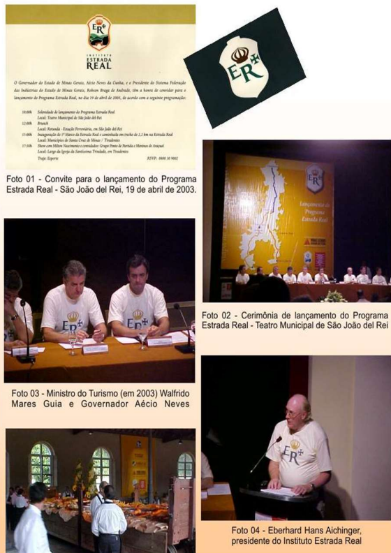
Figura 03 - Cerimônia oficial de lançamento do Programa Estrada Real.

Abaixo, encontram-se algumas imagens da cerimônia oficial, as quais, foram retiradas da forma como se encontravam na dissertação de Silvana Toledo de Oliveira.