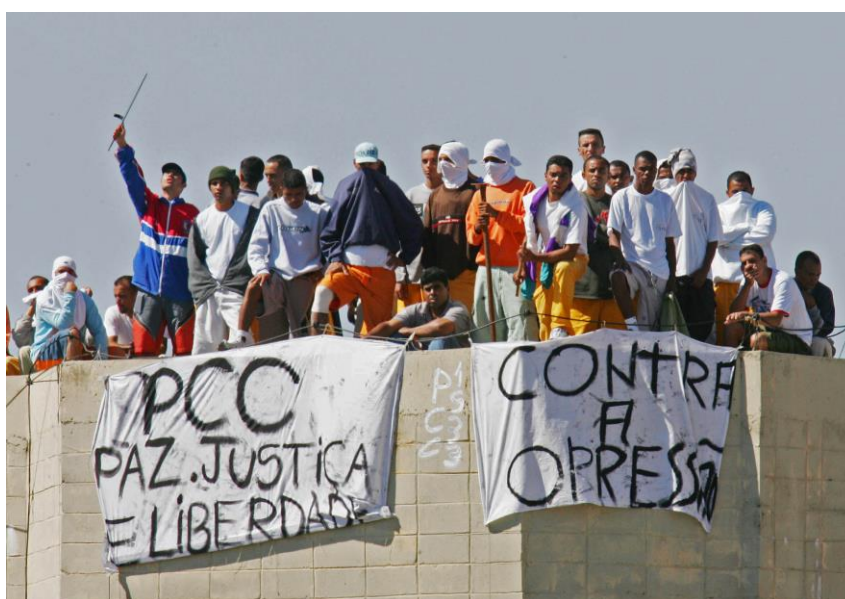
Figura 1 - Rebelião do PCC (Primeiro Comando da Capital) em presídio de Junqueirópolis em maio de 2006

No que diz respeito aos novos focos da organização, houve uma grande influência de mafiosos italianos detidos no mesmo presídio em que se encontrava Marcola, e assim se trouxe o caráter de “empresa” paraestatal da facção. A criação do estatuto do PCC se deu com base em como as máfias italianas se estruturam. Além disso, essa conexão possibilitou a instrução aos membros do PCC de como realizar sequestros, assaltos mais elaborados e formas de gestão mais eficazes para uma maior consolidação e “profissionalização” da organização (FELTRAN, 2018).