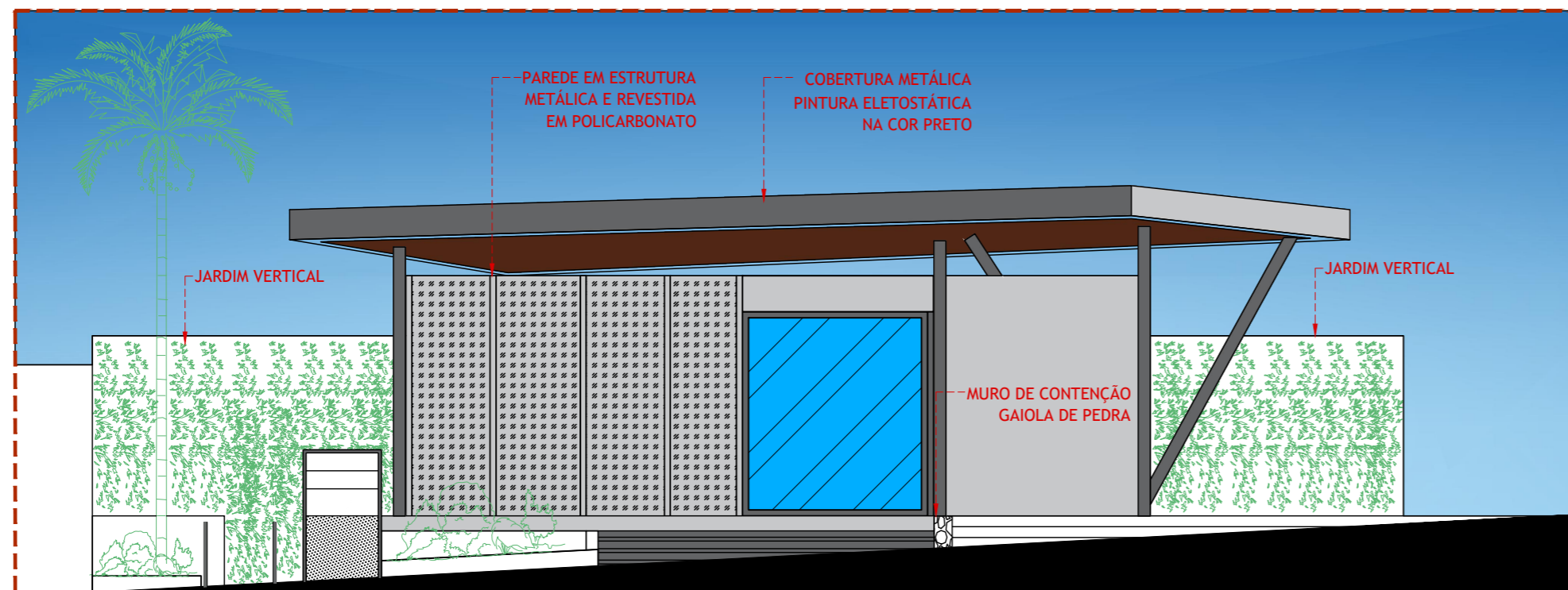
ELEVAÇÃO 02 ESC 1:100