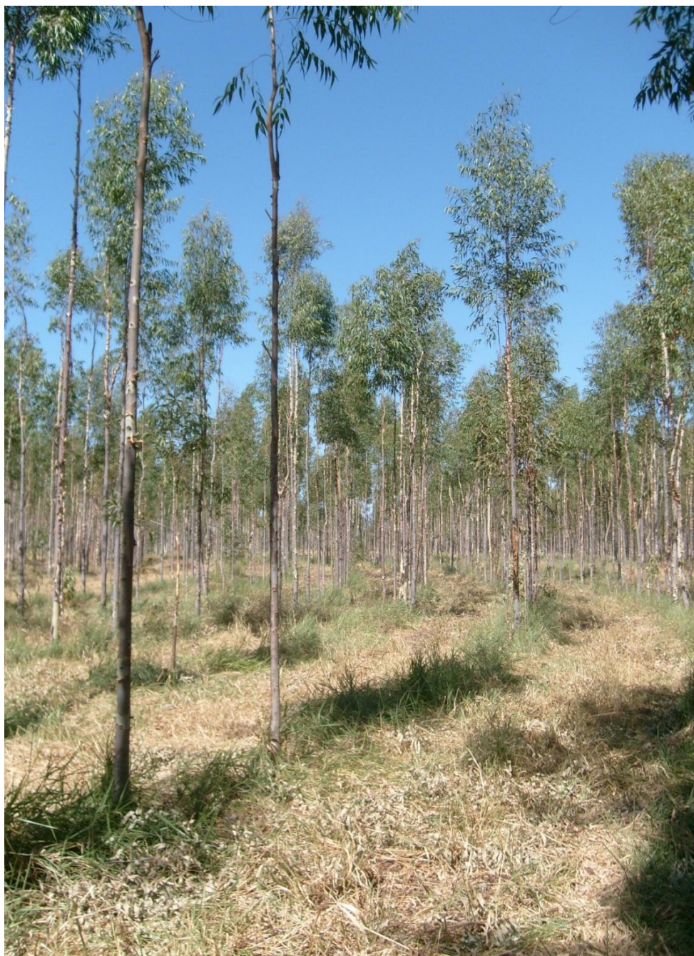
Figura 1 – Eucalyptus citriodora após retirada das folhas para extração de óleo vegetal, aos três anos de idade na região do Prata, MG. 2008.

dependendo das condições de clima, solo e tratos culturais, o intervalo pode ser reduzido. Normalmente, realiza-se o corte raso aos 4 ou 5 anos de idade, quando as árvores tornam-se muito altas e a coleta das folhas difícil. Com a derrubada das árvores, a coleta das folhas é então realizada com a copa no chão. Após o corte raso das árvores faz-se a condução da brotação, deixando-se de 2 a 4 brotos vigorosos por cepa para o reinício da atividade anual de coleta de folhas (VITTI; BRITO, 1999).