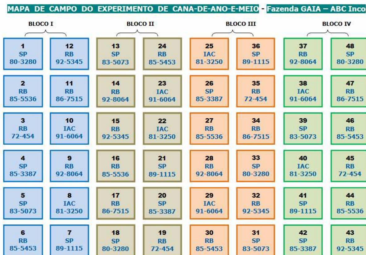
Figura 03 – Esquema de campo do experimento no sistema de cana-de-ano-e-meio.

Na seleção das variedades para o experimento no sistema de ano e meio, levou-se em consideração o número de colmos por metro junto com o aspecto vegetativo geral que apresentavam. Com um bom número de colmos por metro e, ao mesmo tempo, um bom ou ótimo aspecto geral de desenvolvimento vegetativo (que são indicativos de produtividade agrícola, ou seja, toneladas de colmos por hectare - TCH), as 10 variedades foram selecionadas dentre as 23 plantadas anteriormente, para fazerem parte do próximo experimento (instalado em abril/2008), como podem ser visualizadas no esquema de campo apresentada na Figura 3.