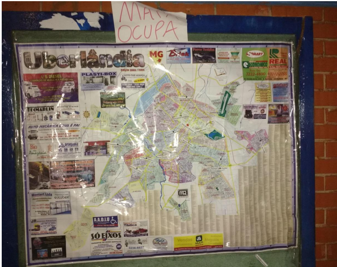
Figura 1 – Mapa das ocupações elaborado pelos estudantes da Escola Estadual Professor José Ignácio de Sousa