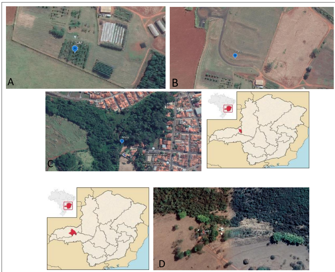
Figura 1. Área de estudo. Localização da área experimental. A. Área de Sistema Agroflorestal – SAF1 ( 18^{\circ}43'36.6''S 47^{\circ}31'33.9''W ); B. Área de pasto ( 18^{\circ}43'33.5''S 47^{\circ}31'33.0''W ); C. Área de mata nativa ( 18^{\circ}43'49.9''S 47^{\circ}30'13.4''W ), localizados em Monte Carmelo-MG; D. Área de Sistema Agroflorestal – SAF2 ( 19^{\circ}04'05.0''S 48^{\circ}27'51.6''W ) localizado em Uberlândia-MG.

O estudo foi realizado em quatro áreas distintas localizadas nos municípios de Monte Carmelo e Uberlândia, Minas Gerais, Brasil (Figura 1).