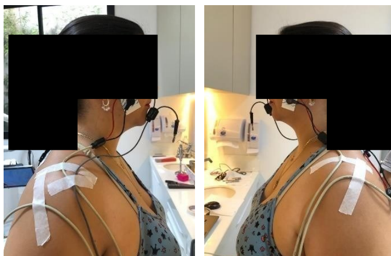
Figura 4: Posição dos eletrodos no músculo masseter direito e esquerdo da voluntária.

Inicialmente, os eletrodos foram posicionados nos músculos masseter (Figura 4) e trapézio (Figura 5) para realização do exame eletromiográfico. As coletas ocorreram em: 1) Repouso; 2) MIH; 3) Mastigação e 4) Levantamento fisiológico dos ombros sem resistência. Nas três primeiras situações, os resultados da atividade elétrica desses músculos foram registrados durante um período de 10 segundos. Para realização do exame em mastigação foram utilizadas duas pequenas gomas de mascar, uma em cada antímero na região de molares. Já para a situação em movimentos de levantamento fisiológico dos ombros sem resistência o registro ocorreu durante um período de 30 segundos.