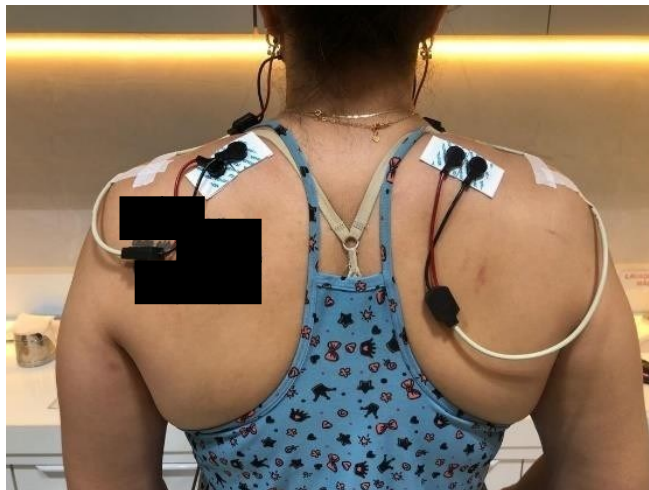
Figura 5: Posição dos eletrodos no músculo trapézio direito e esquerdo da profissional.

Após as coletas eletromiográficas serem realizadas nos músculos acima, os eletrodos foram posicionados nos músculos eretores da espinha (Figura 6). As coletas nesse músculo ocorreram em: (1) Repouso e 2) Movimento de flexão e extensão da coluna por um período de 30 segundos em movimentos repetidos e contínuos.