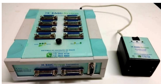
Figura 1: Eletromiógrafo.

Eletromiógrafo – Os registros foram obtidos utilizando-se um eletromiógrafo computadorizado - EMG System do Brasil 830 C (EMG System do Brasil LTDA, São José dos Campos, SP, Brasil) projetado de acordo com normas da International Society of Electrophysiology and Kinesiology (ISEK). O aparelho contém as seguintes características: oito canais de entrada para sinais EMG provenientes de eletrodos passivos ou ativos; dois canais de entrada para sinais auxiliares, como células de carga, eletrogoniômetros e equipamentos isocinéticos; comunicação com o computador via porta USB, rede Ethernet - TCP-IP, radio frequência; conversor analógico/digital com resolução de 16 bits, ganho do amplificador de 1000 vezes, filtros Butterworth passa alta de 20 Hz e passa baixa de 500 Hz; alimentação do equipamento por bateria recarregável integrada externa (Figura 1).