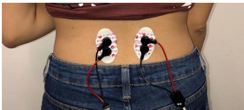
Figura 6: Posição dos eletrodos nos músculos eretores da espinha direita e esquerda da voluntária.

Após as coletas eletromiográficas serem realizadas nos músculos acima, os eletrodos foram posicionados nos músculos eretores da espinha (Figura 6). As coletas nesse músculo ocorreram em: (1) Repouso e 2) Movimento de flexão e extensão da coluna por um período de 30 segundos em movimentos repetidos e contínuos.