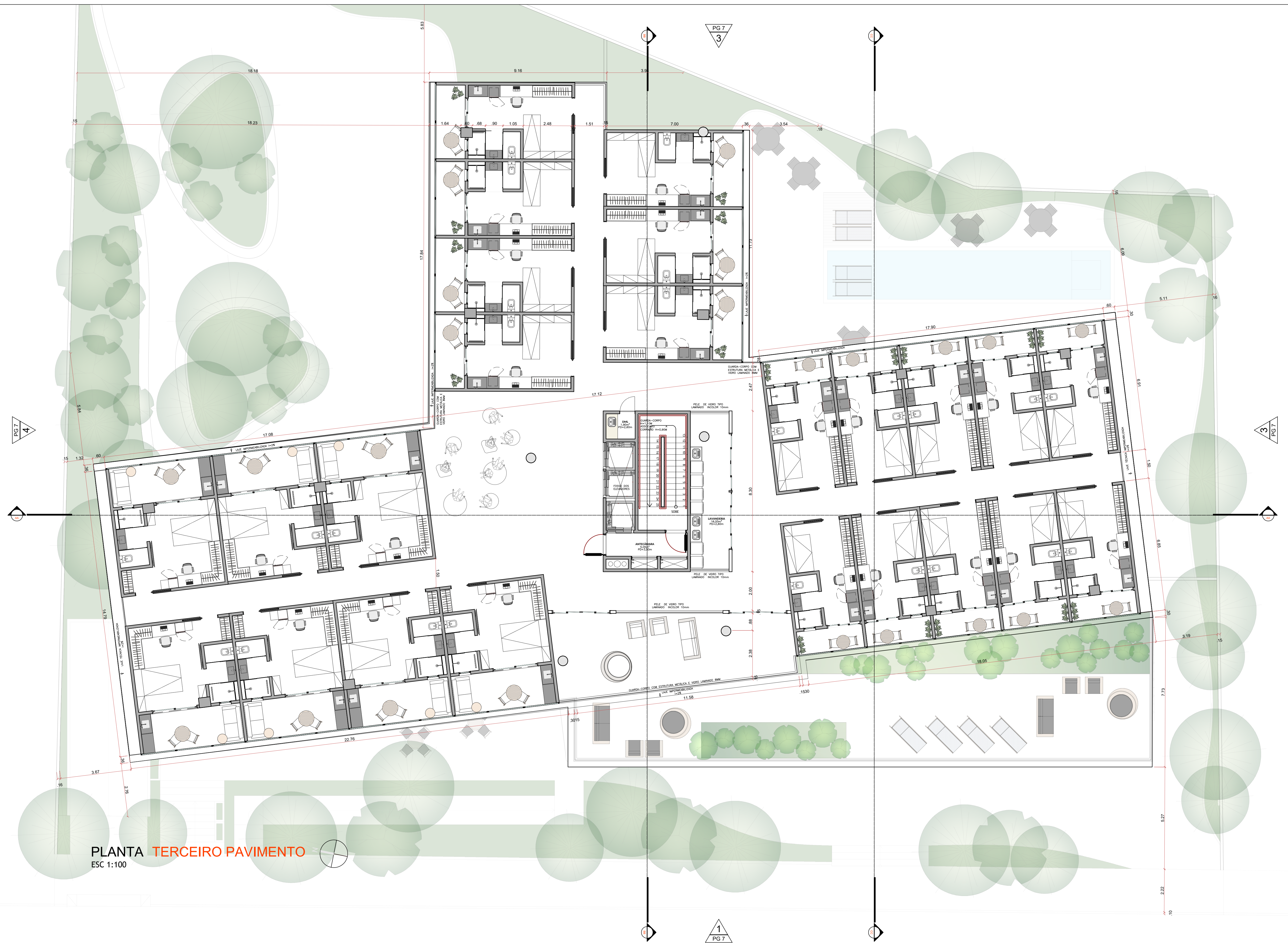
PLANTA TERCEIRO PAVIMENTO ESC 1:100