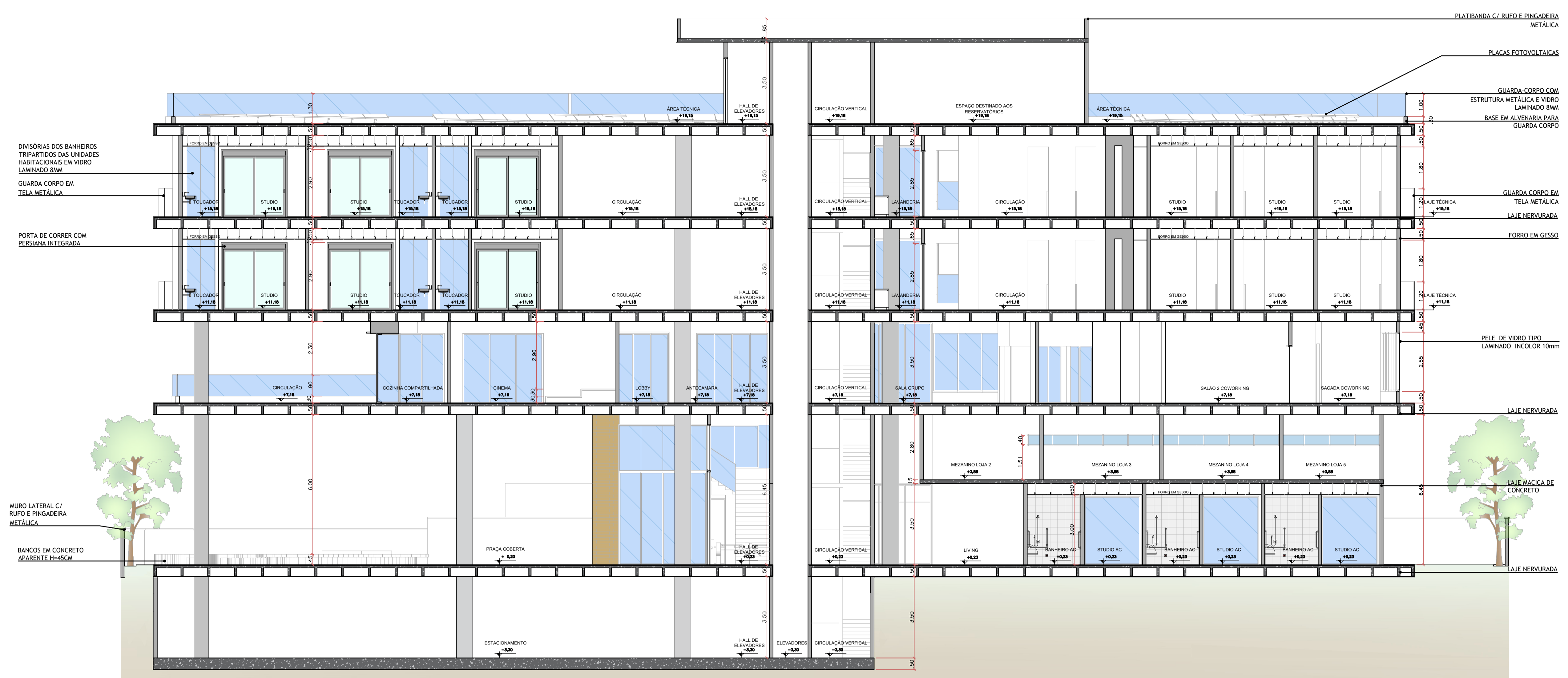
CORTE AA ESC 1:100