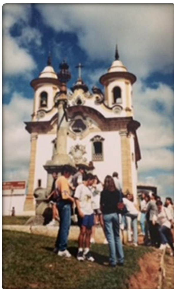
Imagens do Trabalho de Campo realizado em Ouro Preto e Mariana (MG), respectivamente, com alunos do Colégio Atheneu de Uberlândia, 1994.