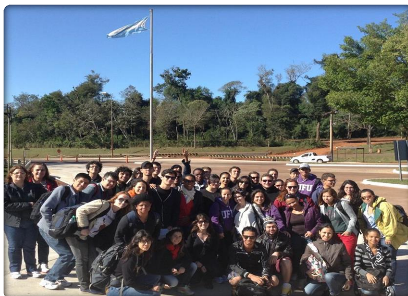
Trabalho de Campo realizado no estado do Paraná nas cidades de Maringá e Foz do Iguaçu, na Cidade do Leste (Paraguai) e em Porto Iguaçu (Argentina), em 2015.