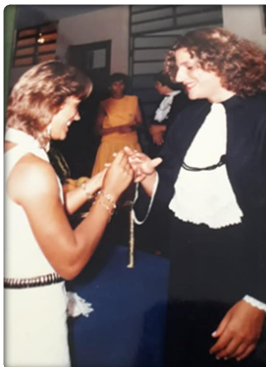
Cerimônia de Formatura, Conclusão do Curso de Magistério no Colégio Estadual Visconde de Mauá (atual Colégio Estadual Benoil Francisco Marques Boska), Ourizona – PR, 1985.