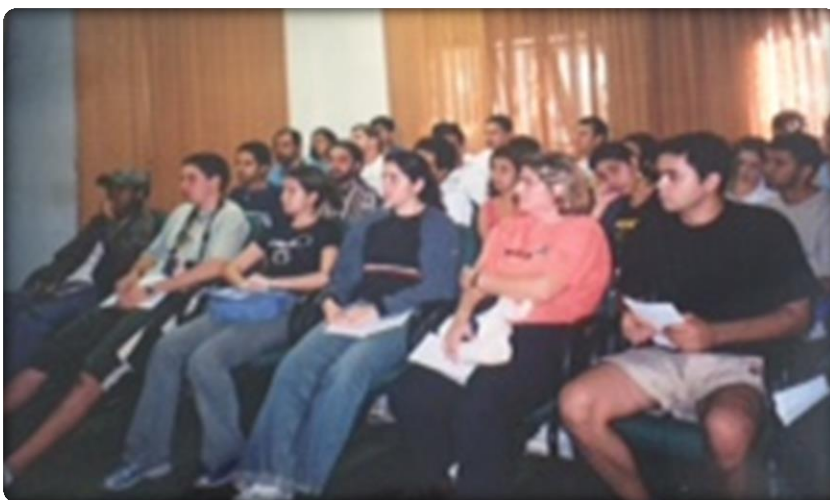
Trabalho de Campo realizado com alunos do Curso de Graduação em Geografia da UFU no Norte de Minas Gerais. As imagens ilustram a visita técnica realizada no Projeto de Irrigação do Jaíba, em 2003.