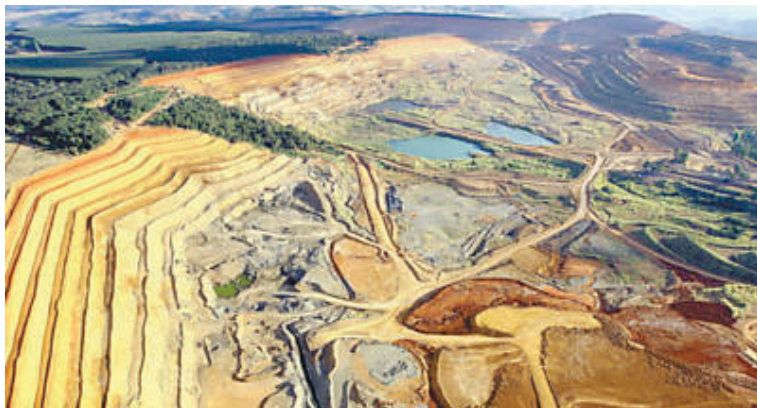
Figura 3: Jazida da Vale em Tapira/MG Alto Paranaíba

Mesorregião do Triângulo Mineiro e Alto Paranaíba onde estão localizadas mineradoras tais como as empresas Vale e Galvani.