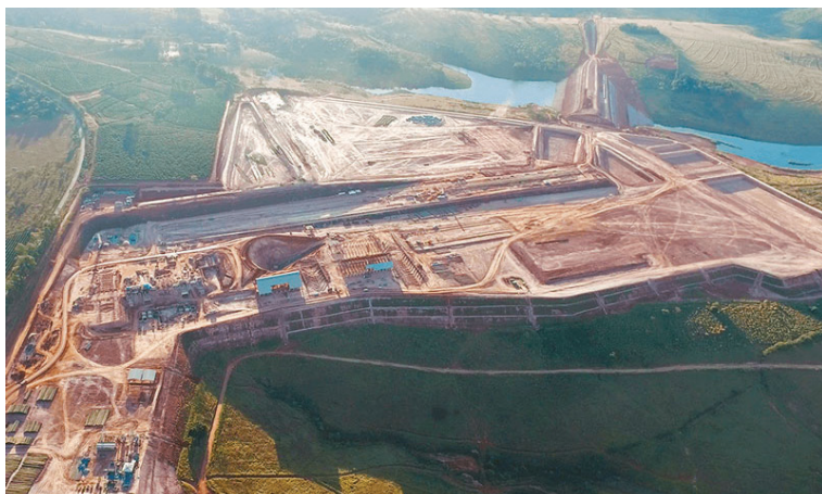
Figura 4: Imagem empresa Galvani na Serra do Salitre