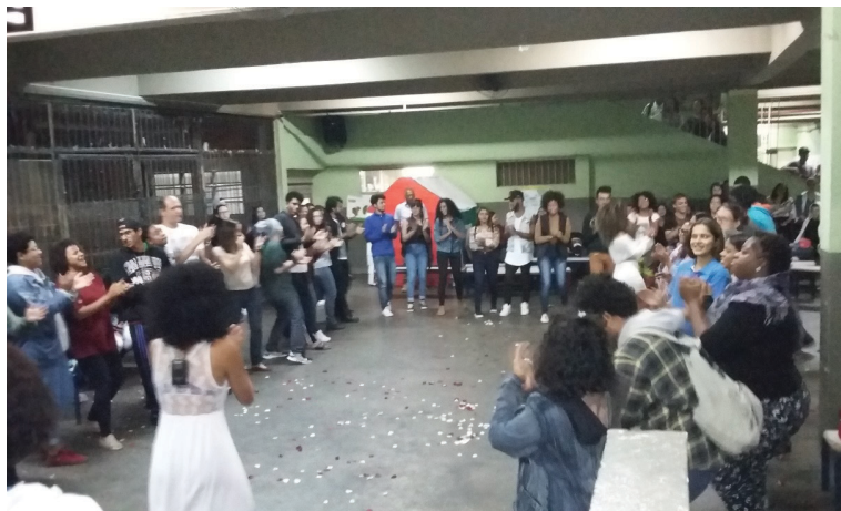
Roda de Jongo – Sarau da Pretas – EE Vianello Gregório – 24/10/2017

zado. A confraternização improvisada entre os presentes e as integrantes do coletivo estabeleceu ritualmente a volta à cotidianidade nos termos conceituais de Turner (1974).