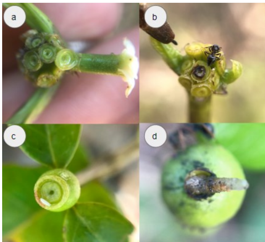
Figura 1 – Flor (~10mm de comprimento) e disco nectarífero produzindo néctar logo após a queda da flor, constituindo assim o nectário pericarpial – NP (a); Crematogaster sp. forrageando nos NPs (b); ovo (~1,5mm de comprimento) (c) e abrigo em estágio intermediário de desenvolvimento (~2mm de comprimento) (d) de Rhinoleucophenga myrmecophaga (Diptera: Drosophilidae) em Cordia elliptica (Rubiaceae) em uma área de cerrado brasileiro.