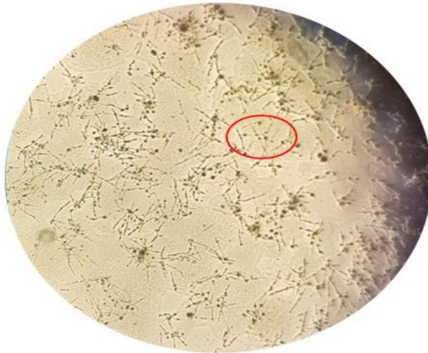
Imagem 2 - Tubos germinativos de conídios de Beauveria bassiana , 50% maior que seu tamanho normal