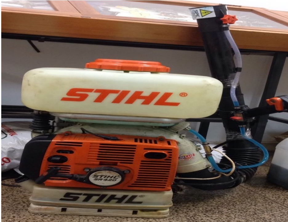
Imagem 1- Pulverizador costal motorizado Stihl SR420

como fonte elétrica bateria portátil e corrente de aterramento, já que neste modelo do kit a eletrificação é por indução.