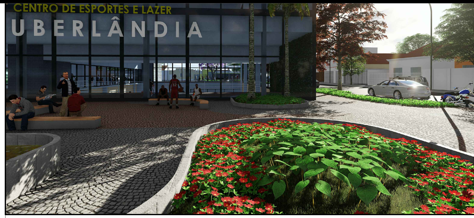
PAISAGISMO - QUADRO DE ESPÉCIES