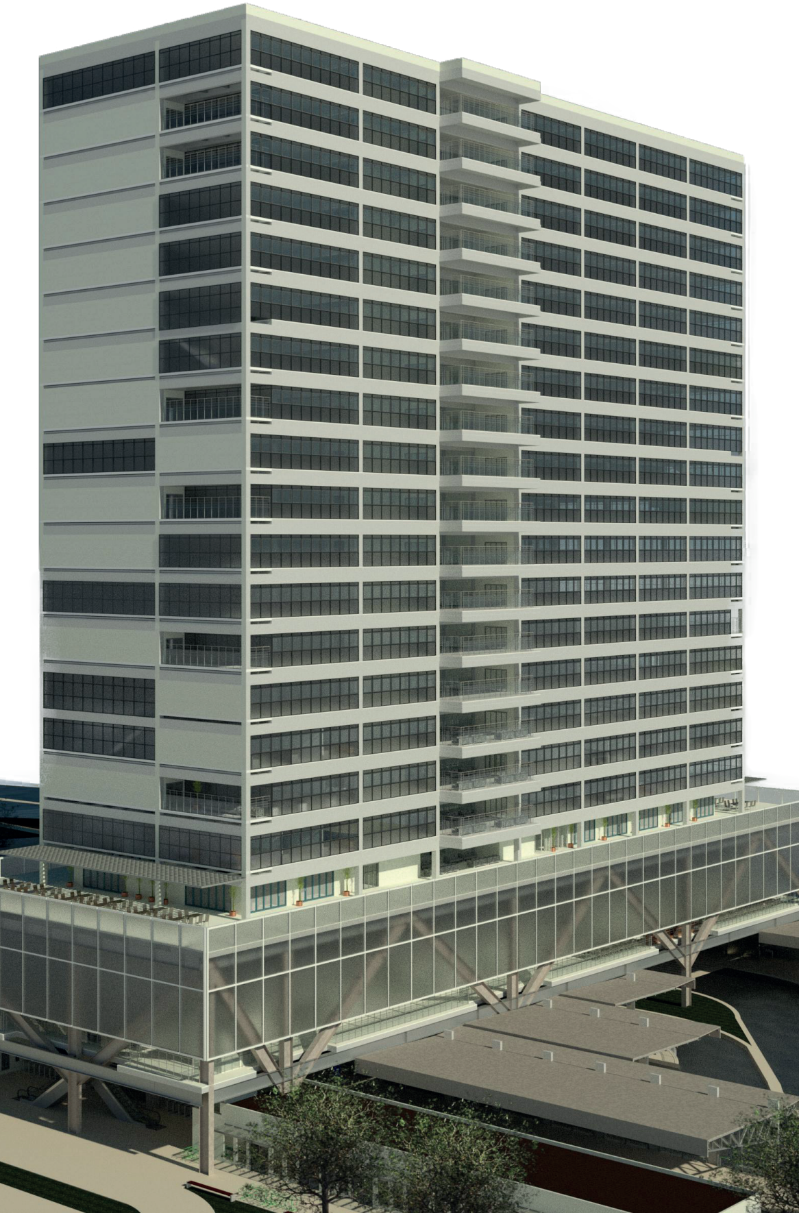
PERSPECTIVA ISOMÉTRICA DO CONJUNTO VISTA DA FACHADA P/A AV. JOÃO PESSOA.

PLANTA TÉRREO Plataformas de embarque e desembarque do SIT Box comerciais ESC 1:200