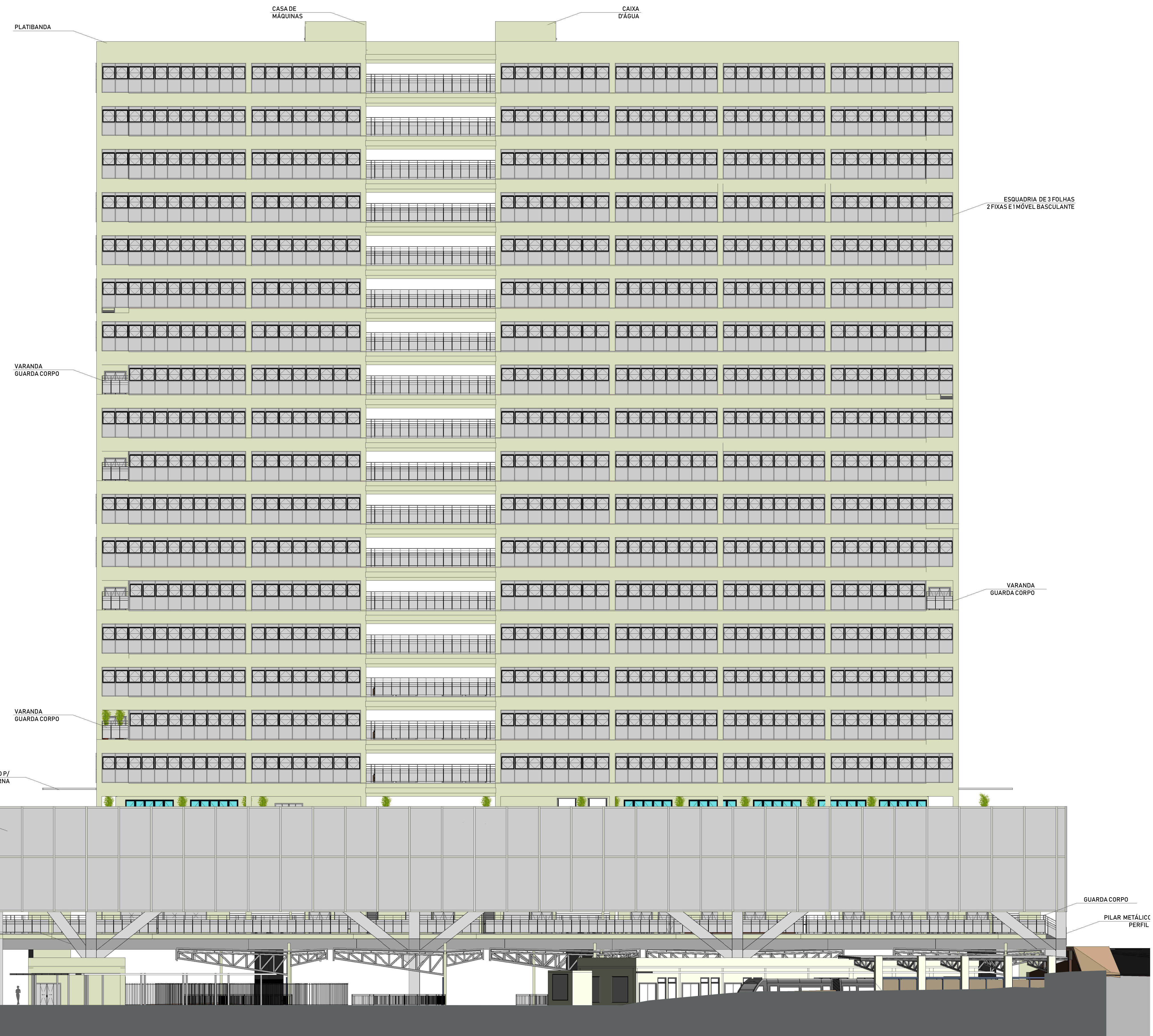
FACHADA SUDESTE - AV. AFONSO PENA ESC 1:200