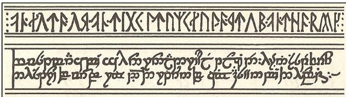
Figura 1: inscrições encontradas às margens das páginas iniciais d' O Senhor dos Anéis

Ao folhear O Senhor dos Anéis o leitor encontrará logo nas primeiras páginas a seguinte inscrição: