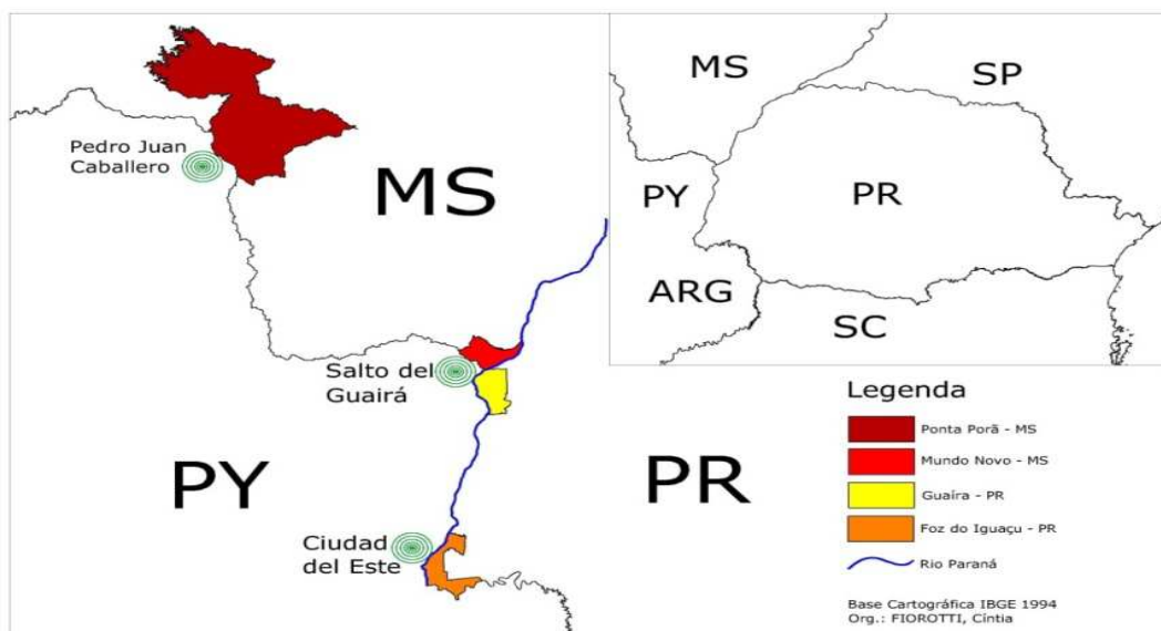
Figura 2 - Localização de algumas cidades com grande fluxo de pessoas com comércio e transporte de mercadorias na fronteira Brasil-Paraguai, 2010. 3

Entre os trabalhadores pesquisados estão: jovens brasileiros e paraguaios ocupados como vendedores em lojas de importados com contratos de trabalho formais e/ou informais na cidade de Salto del Guairá, Paraguai; vendedores ambulantes ocupados nas ruas desse mesmo município; e trabalhadores envolvidos na travessia ou no transporte de mercadorias não regulamentadas e/ou ilegais, residentes em cidades brasileiras no Estado do Paraná ou no Estado do Mato Grosso do Sul.