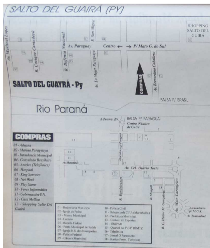
Figura 4 - Mapa de propaganda de Salto del Guairá