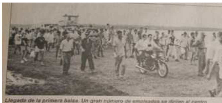
Figura 3 - Trabalhadores na travessia da Balsa Guaira - Salto del Guairá

131