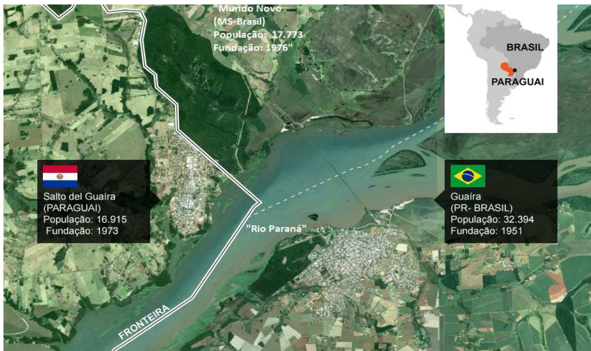
Figura 1- Localização de Salto del Guairá no Paraguai, Guaíra-PR e Mundo Novo-MS no Brasil.

Anotações na imagem entre aspas feitas pela autora.