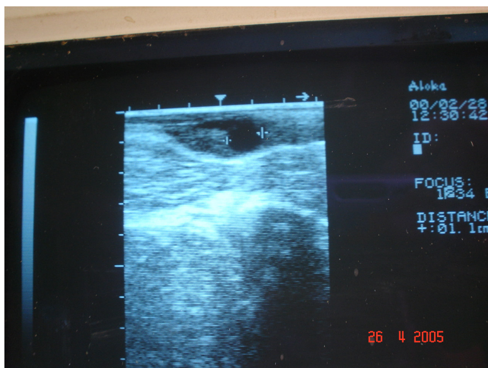
Figura 6 - Ultra-sonografia do ovário – folículo