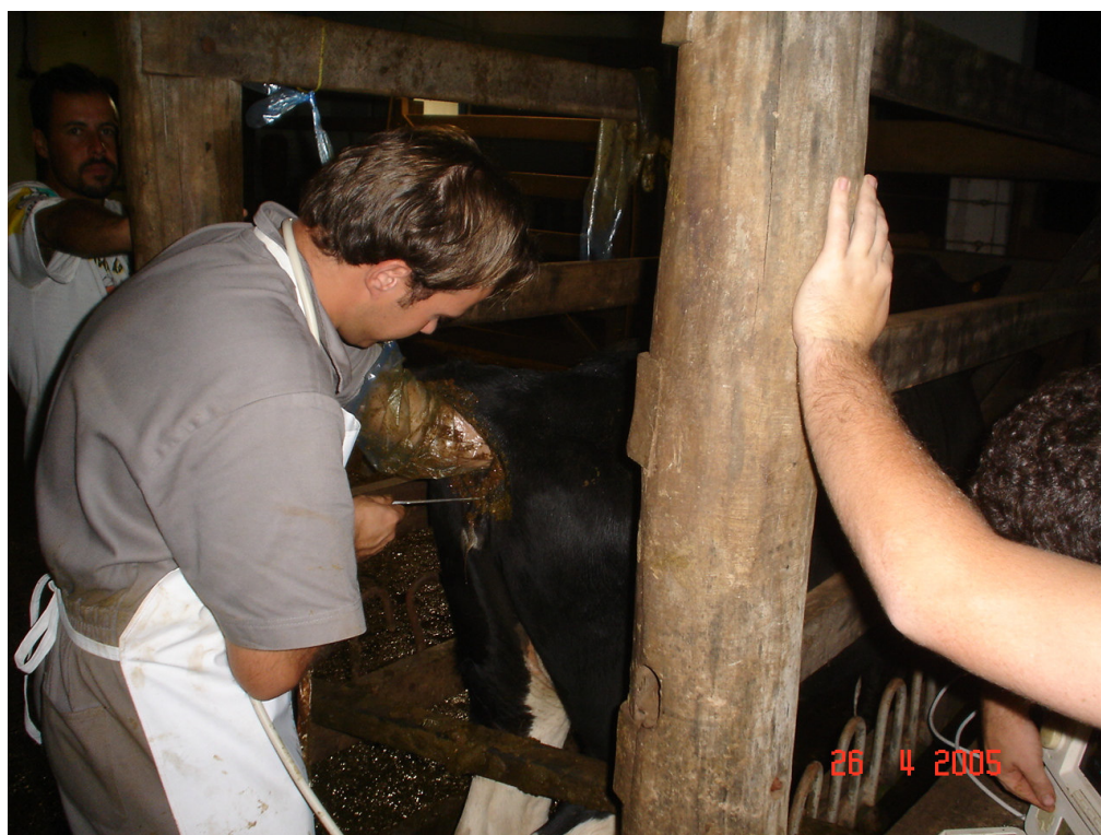
Figura 7 - Inseminação Artificial dos animais.